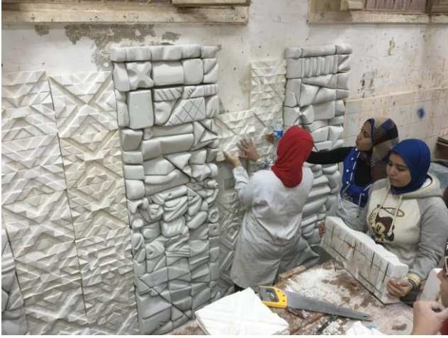
شكل (٩) تفصيلية مرحلة التجميع والتركيب للجدار