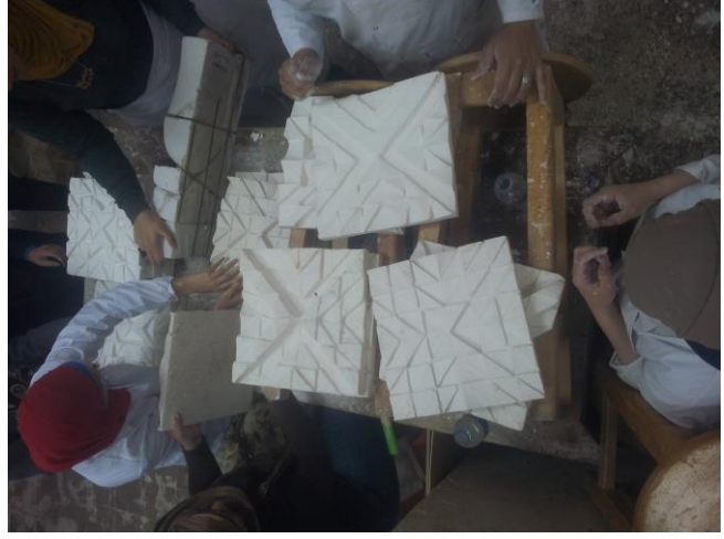
شكل (١٠) تفصيلية مرحلة التجميع للبلاطات الجبسية