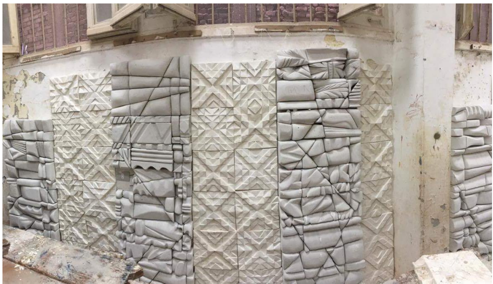
شكل (١٧) مرحلة الانتهاء من التركيب والنجميع للجدار اليسر من القاعة