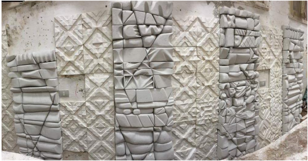
شكل (١٦) مرحلة الانتهاء من التركيب والنجميع للجدار اليسر من القاعة