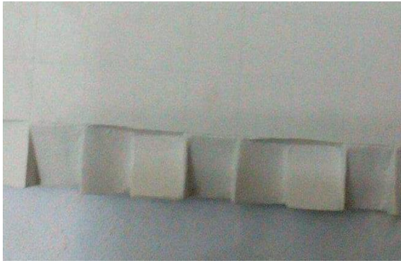
شكل (٣) مرحلة تنفيذ البلطة الجبس