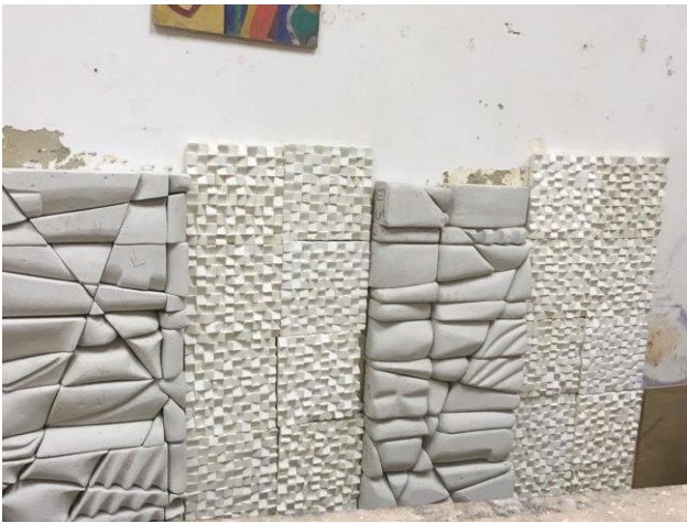
شكل (١٣) مرحلة الانتهاء من التركيب والتجميع للجدار الامامي من القاعة