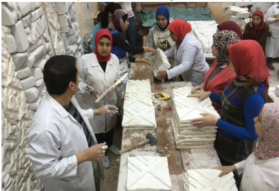
شكل (٧) تجميع وتركيب البلاطات الجبسية والقوالب الحجر على الحائط