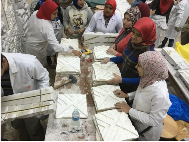
شكل (١١) مرحلة التجميع باستخدام الحديد المسلح في التركيب