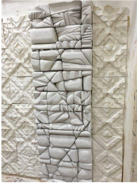
شكل (١٥) مرحلة الانتهاء من التركيب والنجميع للجدار الامامى من القاعة