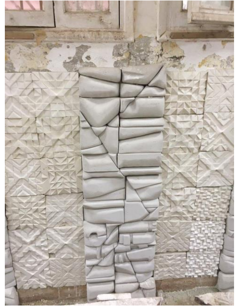
شكل (١٤) مرحلة الانتهاء من التركيب والنجميع للجدار اليمين من القاعة