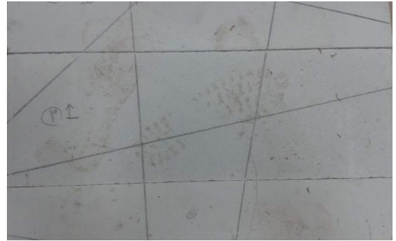
شكل (٤) مرحلة التخطيط على قالب الحجر الخفاف