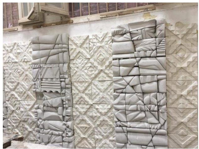
شكل (١٢) مرحلة الانتهاء من التركيب والتجميع للجدار اليمين من القاعة