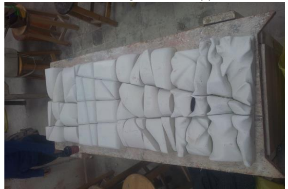
شكل (٦) مرحلة تجميع القوالب الحجر بعد الانتهاء من التشكيل