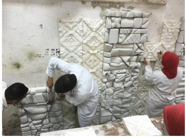
شكل (٨) تفصيلية مرحلة التجميع والتركيب للجدار