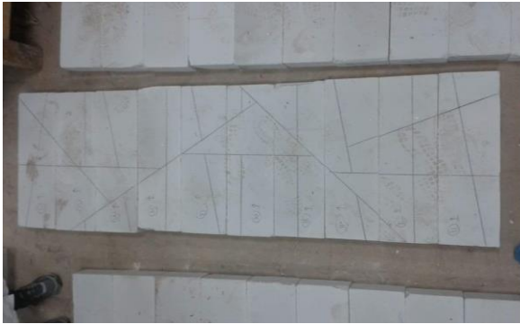
شكل (٥) مرحلة التخطيط على قالب الحجر الخفاف وترقيم القوالب