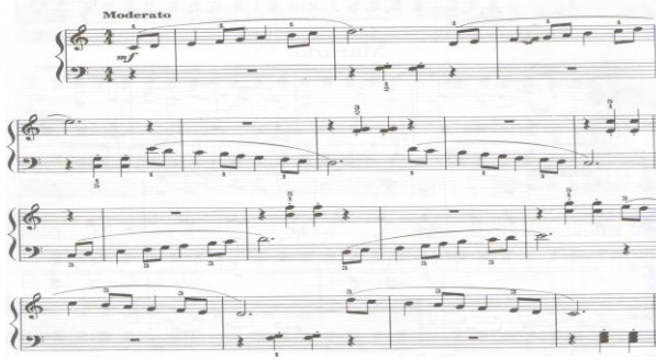
الشكل رقم (٩) يوضح المؤلفه بعنوان " وثب سلمي "

يشير المؤلف الى ان المؤلفه تمهيد لعزف السلم الكبير وينصح بأداء التمرين في السلالم الكبيرة "صول" ، "ري" ، "مي" ، كما يؤكد على ضرورة استخدام المرونة والتأني اثناء مرور الإبهام اسفل الإصبع الثالث بدون حركة مفاجئة من الرسغ أو الكوع .