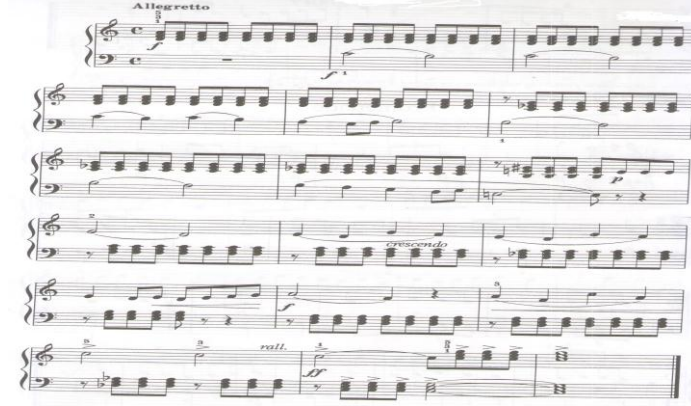
الشكل رقم (٧) يوضح المؤلفة بعنوان " بالاد "

والثانية والرابعة ، تتسم بالتباين بين شدة الصوت (F) والخفوت (P) ثم الى الأكثر شدة (FF)، استخدم المؤلف مصطلحات وعلامات التدرج في الشدة - الإبطاء التدريجي - النبر المفاجئ مثال الشكل التالي رقم (٧) :