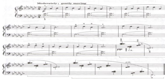
الشكل رقم (٥) يوضح المؤلفة بعنوان " معبد ضوء القمر "

على شكل باص متصل، تتسم بالخفوت من ( p ) الى ( pp ) يؤكد استخدام المؤلف مصطلح يدل على أسلوب الأداء بلطف ( Gently moving ) وظهور مصطلح الإبطاء التدريجي مثال الشكل التالي رقم (٥) :