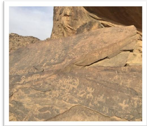
شكل رقم (١) : نقوش تمثل رسم صخرية من بيئة منطقة أودية القويعية. http://alsahra.org