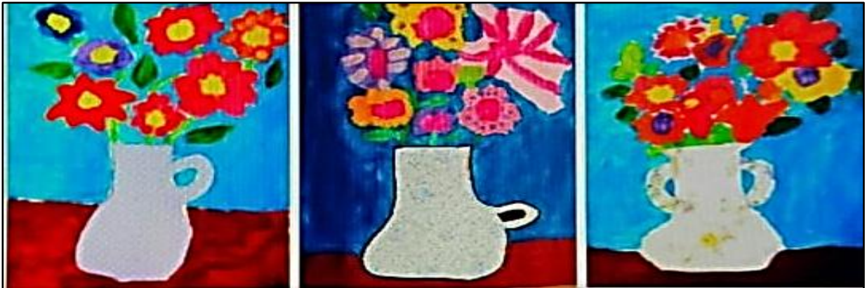
شكل (٢) يوضح نماذج من الانشطة الفنية للفنون الابداعية والتعبيرية لاطفال مرضي