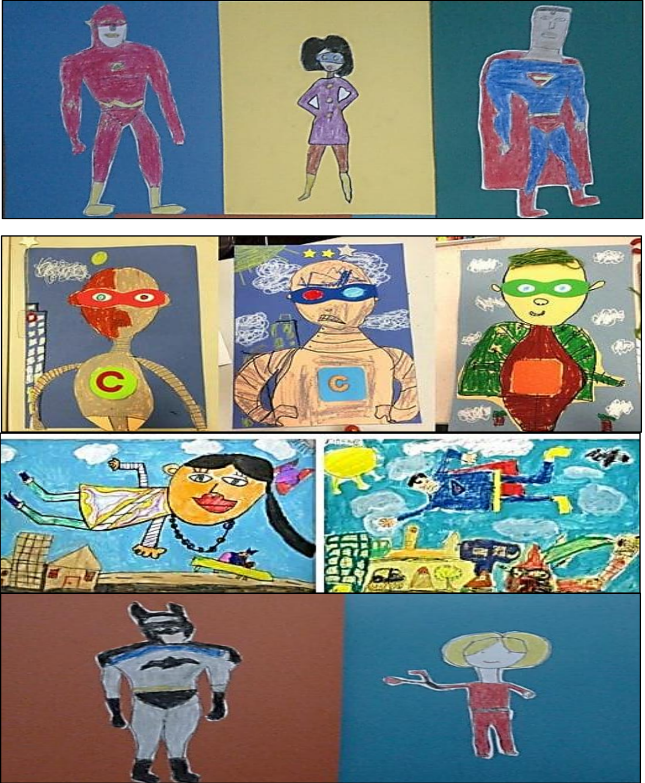
شكل (٥) يوضح نماذج من الانشطة الفنية للفنون الابداعية والتعبيرية لاطفال مرضي السرطان ٥٧٣٥٧ في رسم (البطل الخارق)

(AmeSea Database – ae – April- 2022- 567)