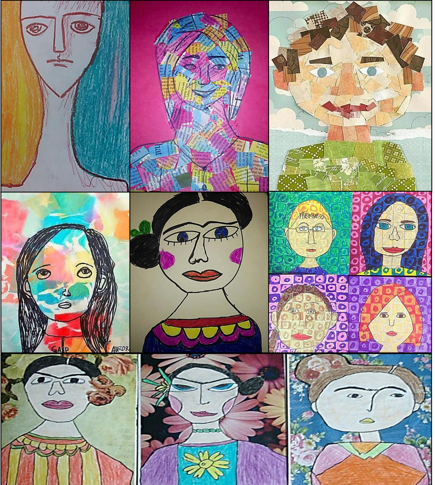
شكل (١) يوضح نماذج من الانشطة الفنية للفنون الابداعية والتعبيرية لاطفال مرضي