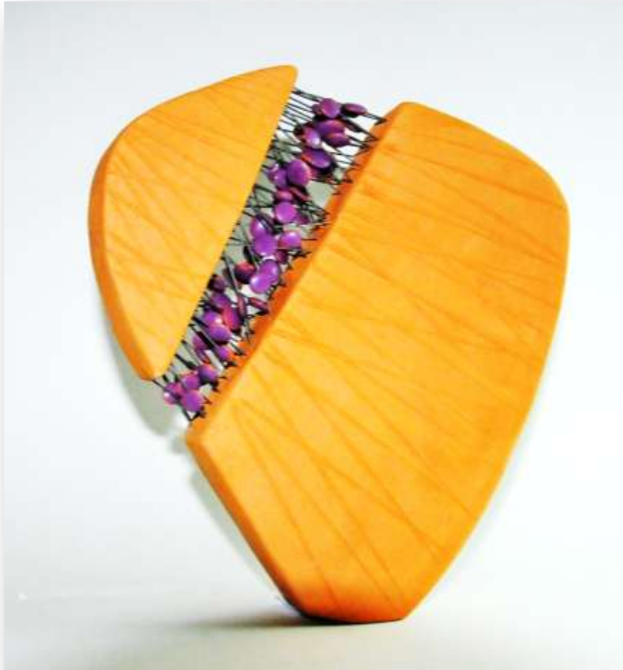
شكل رقم (٨)

وتحققت الوحدة في الشكل عن طريق اللون من خلال درجة الحمرة المعروفة في الحريق الأولى "البسكويت" مع درجة اللون الذي عمد الباحث إلى توحيد به درجة البنفسجي المائل للحمرة في الدوائر الخزفية المتداخلة للأعمدة الفلزية.