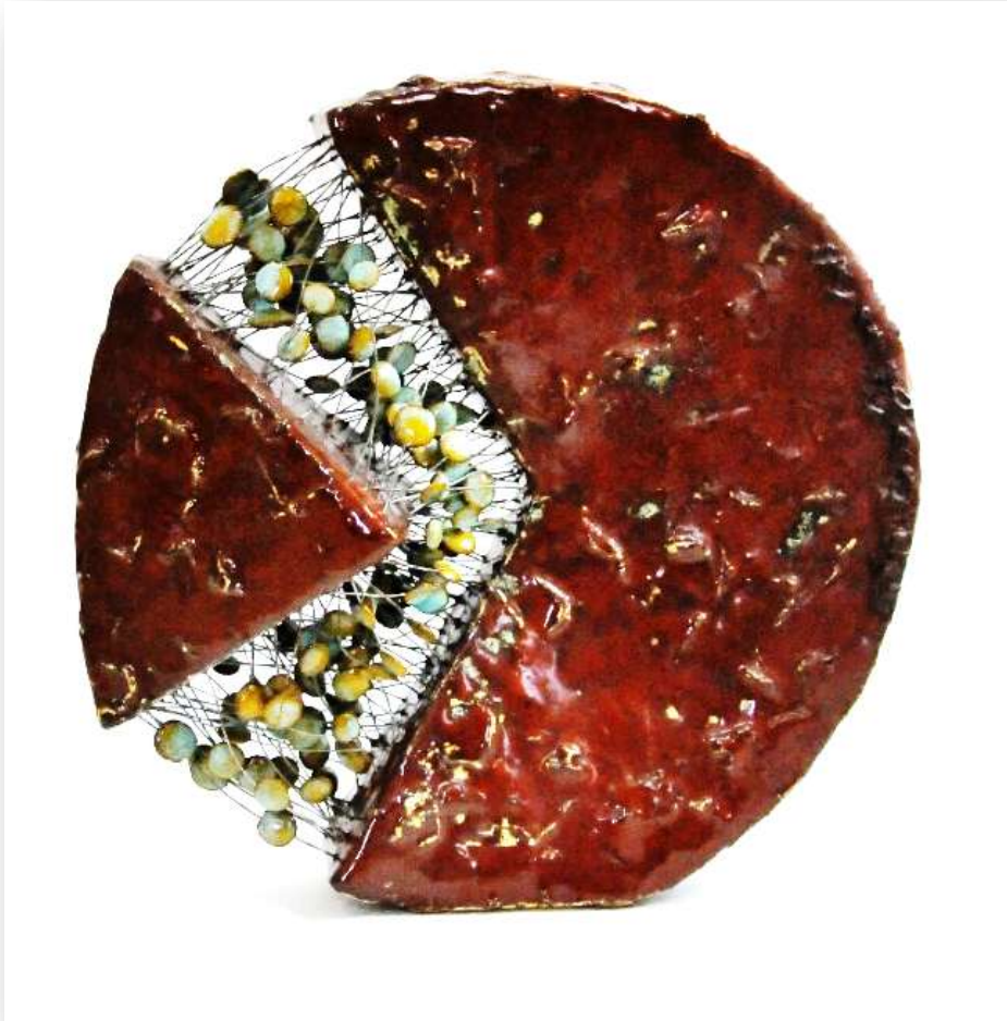
شكل رقم (٦)

إلا أنها ترتبط دائما بثوابت دائمة بالجزور حيث جاء هذا الارتباط عن طريق معالجة الباحث لمفهوم الكل بالجزء عن طريق الأسلاك الممتدة المستقيمة مما اوجد شدا فراغي بين كلا الكتلتين الكبيرة والصغيرة في اتزان وثبات.