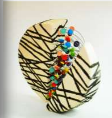
شكل رقم (٧)