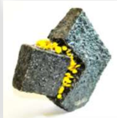
الشكل رقم (١)

(AmeSea Database – ae – Oct - 2022- 592)