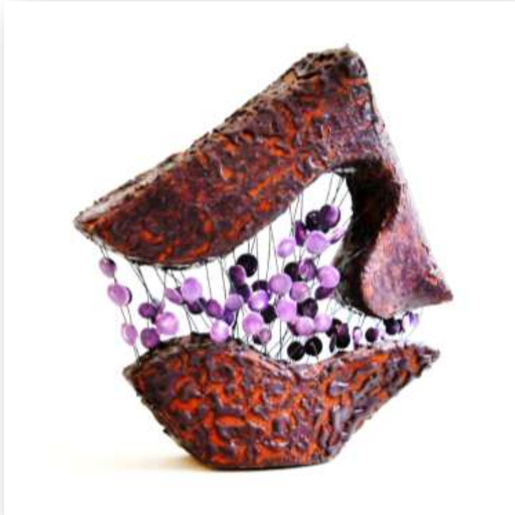
شكل رقم (٥)

يتكون هذا العمل من جزئين، الجزء الأصغر يوجد في الأسفل يجذب الجزء الأكبر الذي يعلوه، ويوحى لنا هذا الشكل في إطاره الخارجي الحر بمعنى الحرية التي تحاول إيجاد مسار لها للتحرك الا إنها ترتبط دائما بثوابت دائمة بالجزور حيث جاء هذا الارتباط عن طريق الأسلاك الممتدة والمستقيمة في ثبات، متعلقا بهذه الأعمدة المعدنية بواقى وجزئيات خزفية بنفس لون الشكل نفسه كنوع ومحاولة من السلخ بين الجزئين دون جدوى، ونجد الشكل هندسي في خطة الخارجي يكاد يكون ذو خط مستقيم يأخذ شكل المعين اما من الداخل فهو ذو خط عضوي منحنى يعطي للمشاهد إحساس بالانفصال وقوة التماسك والجذب بين أجزاء الشكل.