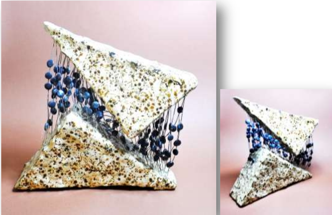
شكل رقم (٤)

كما تحقق التبريد اللوني من خلال تبادل اللون الأسود الذي جاء في الدوائر الخزفية التي تتخلل الأعمدة الفلزية على أرضية بيضاء في جانبي الشكل على هيئة دوائر ملونة سوداء مما يزيد من جدية الارتباط والتظافر بين شقي الشكل.