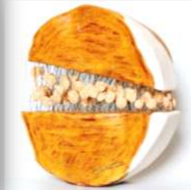
شكل رقم (٩)

(AmeSea Database – ae – Oct - 2022- 592)