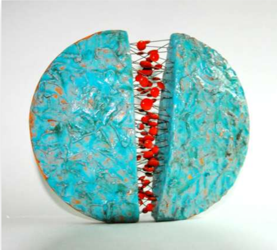
شكل رقم (١١)

وقد عمد الباحث إلى إجراء تأثيرات ملمسية على سطح الشكل جاءت كخطوط ومساحات عشوائية على سطح الشكل للتقابل مع تقاطعات الخطوط التي أحدثتها الأعمدة الفلزية المعدنية.