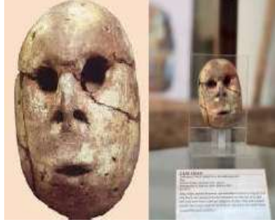
شكل(٢)رأس دمية من الطين المحروق - قرية مرمدة بني سويف ٢

كان في مقاب البداري ، في عام 1982 عثر ايفجنر Evigner علي رأس دمية في قرية مرمدة الدمية خشنة مصنوعة من التراكوتا (لطين المحروق في بني سويف ) و عليها بقايا تلوين و واسعة العينيين صغيرة الانف و الفم مضموم كما كان بها ثقب كثيرة بالرأس لتثبيت خصلات الشعر وأسفل الذقن ثقب كبير لتثبيت الرأس في لواء، و يرجع تاريخ تلك الدمية الي 5000 – 4100 ق.م. ١