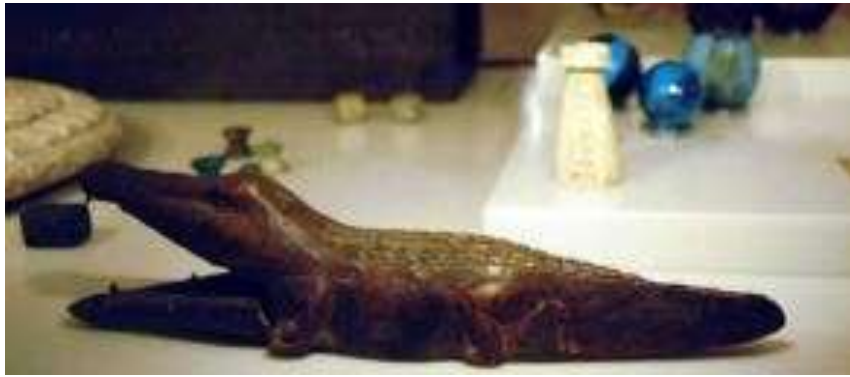
شكل (١١) دمية تمساح بغم يمكن غلقه ٣

والنموذج السابق يوضح دمية اخري لسيدة علي هيئة مجداف و ذات شعر كثيف، عثر عليها عام 1904 م بجبانة بني حسن، و تنتمي الدمية لعصر الدولة الوسطي و حاليا هي محفوظة في متحف ليفربول. تعتبر الدمية المصرية أول دمية متحركة عن طريق الضغط على لولب أو مفصل أو من خلال شد الخيط، لذا يحتفظ متحف اللوفر بعدد كبير منها، كما عثر على عرائس أكثر تعقيدا في تحريكها حيث تعتمد على أفكار ميكانيكية مثل الروافع، مثل نموذج خشبي لتمساح "انوبيس" بالمتحف البريطاني.