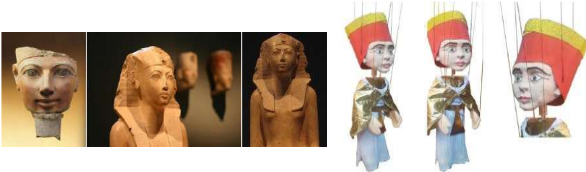
شكل(٣٢) نموذج توضيحي لدمية الملكة حتشبسوت، صورة لبعض تماثيل الملكة حتشبسوت

شكل(٣١) نموذج توضيحي لدمية الملك تحتمس الثالث، صورة لبعض تماثيل الملك تحتمس الثالث يلاحظ أن نحت وتفاصيل الوجه ولون البشرة لا يوضح إذا كانت الدمية مذكرة أم مؤنثة بإستثناء اللحية الصناعية المركبة والتي لا تشبه لحي القدماء المصريين ولكن وضع المصمم مجرد ضفيرة للدلالة عليها في وجه الدمية.