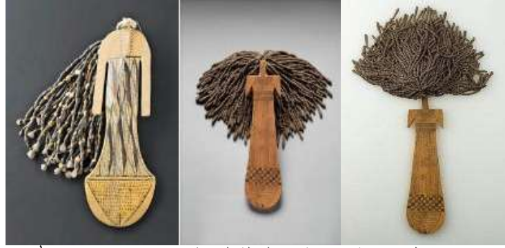
شكل (٦) دمى مصرية من الدولة الوسطى ١٨٠٢ ق.م - ٢٠٣٠ ق.م ١