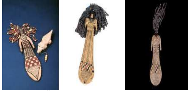
شكل (٧) دمى لفتاة من مصر القديمة ٢