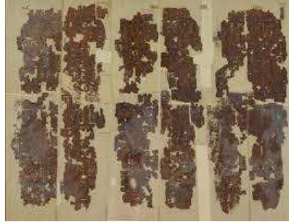
شكل (٢٠) برديات درامية بمعبد الرامسيوم بالاقصر مكتوبة بالخط الهيروغليفي ٢