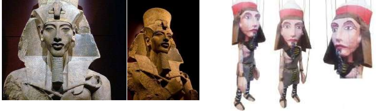
شكل(٣٣) نموذج توضيحي لدمية الملك إخناتون، صورة لبعض تماثيل الملك إخناتون

كانت الملكة حتشبسوت مثالا على الملك القوي، الذي يضع لحية مستعارة فقد أخذت ترتدي أزياء تشبه أزياء من سبقها من الملوك الرجال في الاحتفالات الرسمية.