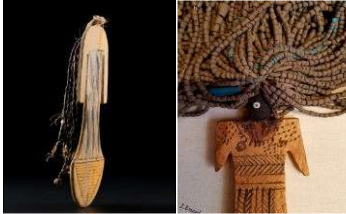
شكل (٨) دمي فتاة ، يحركوا بالخيط - العصر المتأخر ٩٤٥-٦٦٤ ق.م متحف المتروبوليتان - نيويورك ٣