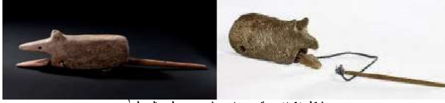
شكل (١٩) دمىة حصان خشبي يحرك بالعجل ١