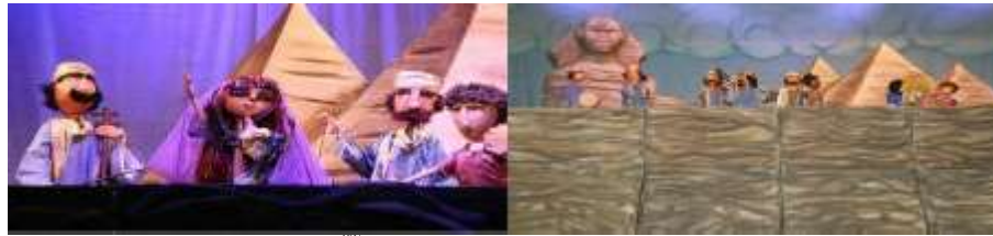
شكل (٢٦) مشاهد من المسرحية ٣٢

و ينتضح في المشاهد السابقة الالتزام بمعالم الحضارة المصرية القديمة من حيث الأزياء والديكور حيث تظهر بعض المشاهد بخلفية ينتضح فيها الأهرامات الثلاثة مع مجسم لابو الهول ومشاهد أخرى يتضح فيها معابد مصرية قديمة ذات الأحجار الضخمة والنقوشات والرسومات المصرية كما تظهر معظم الدمى بأزياء مصرية قديمة، حيث تظهر أزياء الملك والملكة والكاهن وعامة الشعب، الخ ..