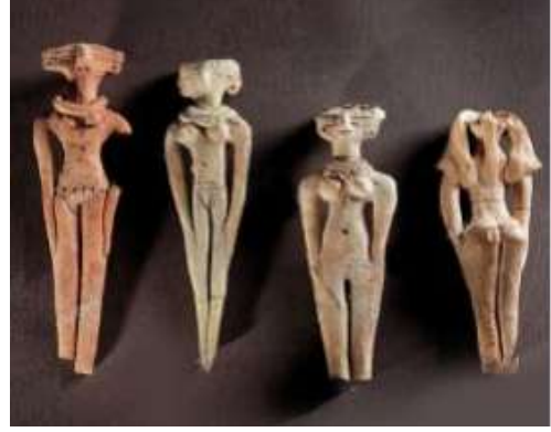
شكل(٤) نماذج لعرائس فخارية وجدت في منطقة جبل الزيت - البحر الأحمر - الدولة الوسطي - محفوظة في متحف اللوفر - باريس ٢ شكل(٥) دمي نساء نحتت من عاج فرس النهر ، 5000 ق.م من مقابر البداري-المتحف المصري ٣

ووجدت الدمى في مصر القديمة ولو بغير السبب الدرامي فمن الحوادث الشهيرة أن بعض السحرة وبعض النساء من حريم الملك رمسيس الثالث قد ضبطوا متلبسين ومعهم عروسة مصنوعة من الشمع على هيئة الملك، وكانوا يتلون عليها بعض التعاويذ السحرية قاصدين إيقاع الأذى بالفرعون وهذا النوع من الأعمال السحرية المعتمدة على العرائس يقوم على فكرة أن تمثيل حادثة ما ومحاكاتها يؤدي إلى حدوثها في الحياة الواقعية للشخص المراد إيذاؤه، بعد أن يتحول الرمز إلى حقيقة واقعية بفضل التعاويذ السحرية، وكان السحرة يشكلون عروسة من أية مادة أولية كالصلصال أو الشمع أو الخشب أو غير ذلك ثم يركبون فيها أثرا من الشخص المطلوب إيقاع الأذى به، كخصلة من شعره أو قطعة من ثيابه، ويقوم السحرة بعد ذلك بإعداد ثياب لتمثيل هذا الشخص، ثم يلبسون العروسة هذه الثياب، ويبدعون في التعويذ عليها بطلاسم السحر ومرامه، وبعد ذلك يعينون العضو الذي ينوون إيقاع الضرر به، فإذا دقوا مسمارا مثلا في عضو معين من أعضاء العروسة فإن نفس العضو في جسم الشخص محل الإيذاء سيصاب بضرر أو أذى أو مرض، وإذا قربوا العروسة من حرارة النار فإن معنى ذلك أن الشخص سيصاب بالحمى وهكذا، وقد صنع المصري القديم العرائس من خامات البيئة المتوفرة لديهم مثل العاج والخشب والحجر والجلد كما اهتموا بتلوينها لإبراز العروسة وشخصيتها وذلك لاعتقاد الفنان المصري القديم ان الألوان تجعل العرائس ذات صورة متكاملة. ٤