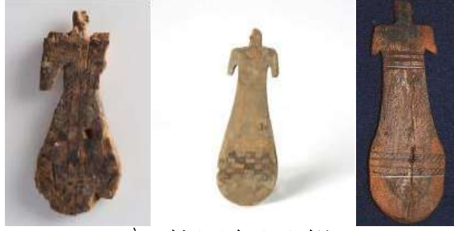
شكل (٩) تفاصيل إضافية لدمى. ١