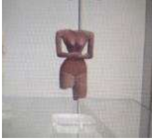
شكل (١) دمى مصرية قديمة - 5000 ق.م - مقابر البداري ١

تدل أقوال المؤرخين على وجود نوعين من الدمى فى مصر القديمة، نوع دقيق أنيق معبر لاتنقصه إلا الخيوط فيتحرك ولكن لم يثبت لدينا أن هذا النوع من الدمى قد استخدم فى مسرح للعرائس، ونوع آخر قيل صراحة أنه دمى تحركها الخيوط وهذه جاء ذكرها على لسان ماجان Magan الذى يقول إن الدمى التى وجدت فى مقابر المصريين القدماء وفى بلاد سوريا كانت ذات وظيفة دينية كذلك جاء فى الاستشهاد السابق ذكره عن هيرودوت Herodotus أن النساء المصريات كن يمثلن بواسطة دمى ذات خيوط أسطورة خاصة بإنجاب الأطفال ٢