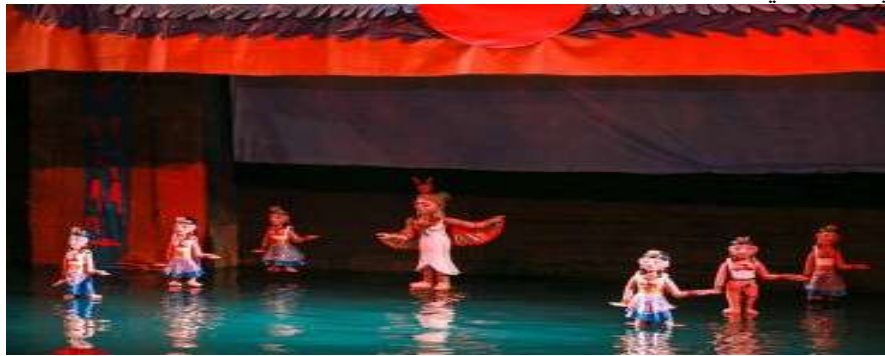
شكل (٢٨) مشهد من المسرحية ٣٤

العرض من إخراج مي مهاب ويعتبر من أول عروض مسرح الدمى المائية المقامة في مصر، ورسمت فيه أسطورة إيزيس و أوزوريس ملامح العرض الرئيسي فيه، يبدأ العرض المائي بظهور مركب مصرية قديمة تحمل بداخلها إيزيس، التي تلقي بحبيبها أوزوريس ويعيشان معا حياة سعيدة، لكن سرعان ما تنتهي بقتله على يد أخوه ست، ويقوم ست بتقطيع جسد أوزوريس إلى 42 قطعة و يلقي كل منها في مكان بعيد لتبدأ رحلة إيزيس في البحث عنه وتجميع اشلائه وتحولت المساحة المائية إلى مسرح مكتمل الأركان، الإضاءات تلقي بظلالها على المياه، فتارة تكون حمراء أوقات الصراع والذروة بين أوزوريس وست وأحيانا تصبح زرقاء بلون النيل الذي تدور فيه رحلة بحث إيزيس عن زوجها، وفي الخلفية وضعت قطعة من الديكور التي بنيت على الطراز المصري القديم لتشير إلى الفضاء الزماني والمكاني للأحداث