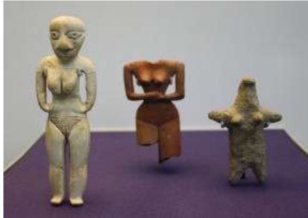
شكل(٣)دمي مصرية قديمة - 5000 ق.م - مقابر البداري ٣

وإذا قارنا الدمي المصنوعة من العاج بالدمي المصنوعة من الطين الصلصال، فأنا نجد أن الثانية تقليد للأولى و كان يستعملها عامة الشعب ، و يذكر أن أول من فكر في صناعة الدمي و من ذلك نعلم ان الفن بدأ في الطبقة الراقية ثم قادم عامة الشعب، و الواقع أن هذا كان طابع الفن المصري القديم في كل عهده.