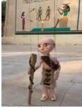
شكل (٢٢) نموذج لدمية من دمي الخيوط ذات الازياء المصرية القديمة- القرية الفرعونية - تصميم رؤوف كمال