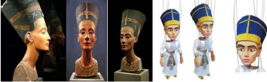
شكل(٣٠) نموذج توضيحي لدمية الملكة نفرتيتي وصورة رأس الملكة نفرتيتي وفي ذلك النموذج لم يلتزم المصمم بأي تفاصيل خاصة بالملكة نفرتيتي سوى لون التاج.

• عرائس العروض المصرية القديمة القرية الفرعونية للمصمم رؤوف كمال قام مصمم والدمى رؤوف كمال بتصميم سلسلة نماذج دمي خيوط تمثل ملوك وملكات الحضارة المصرية القديمة وذلك لبعض العروض المقامة بالقرية الفرعونية، وكما يتضح فيما يلي استخدم المصمم أدوات بسيطة أثناء التصنيع مثل الفوم والقماش، وفيما يلي سيتم عرض تلك النماذج