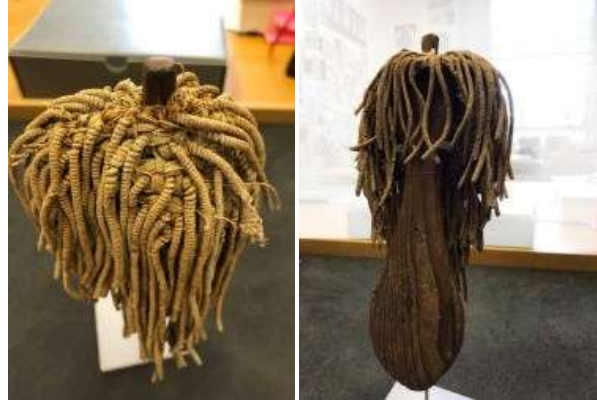
شكل (١٠) تفاصيل لشكل الدمية على هيئة مجداف ٢

والنموذج السابق يوضح دمية اخري لسيدة علي هيئة مجداف و ذات شعر كثيف، عثر عليها عام 1904 م بجبانة بني حسن، و تنتمي الدمية لعصر الدولة الوسطي و حاليا هي محفوظة في متحف ليفربول. تعتبر الدمية المصرية أول دمية متحركة عن طريق الضغط على لولب أو مفصل أو من خلال شد الخيط، لذا يحتفظ متحف اللوفر بعدد كبير منها، كما عثر على عرائس أكثر تعقيدا في تحريكها حيث تعتمد على أفكار ميكانيكية مثل الروافع، مثل نموذج خشبي لتمساح "انوبيس" بالمتحف البريطاني.