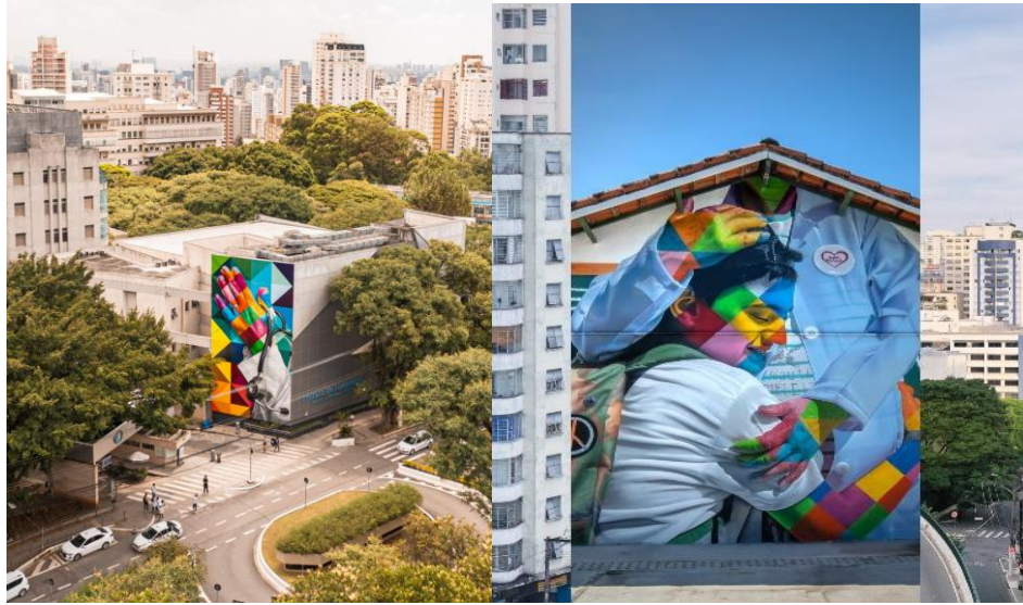
شكل ٩، ١٠

Science والتي رسمت على جدار أكبر مستشفى في أمريكا اللاتينية (شكل ٦، ٧) والفنانة بريسيليا باربوسا Priscilla barbosa والتي قامت بعمل تصوير جداري بعنوان "زهور للأبطال" Floers for sheroes، ضمن حملة تضامن استهدفت موظفي المستشفيات والعاملين الأساسيين فيها. وغيرهم من الفنانين.