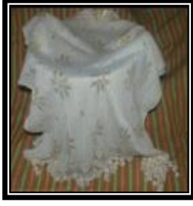
شكل (د - ٢)

يمثل شال من قماش التلى مع اضافة متغير لون الأرضية البيضاء والخيوط الذهبية ويلاحظ التردد والتكرار المنتظم للوحدات والمسافات