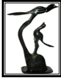
شكل ( ١ - ب )

يمثل طفاية سجانر، به قاعدة مستطيلة الشكل يعلوها كتلة مفرغة يمتد منها أفرع توحى بأنها أفرع شجر يعلوها طائرين متناغمين