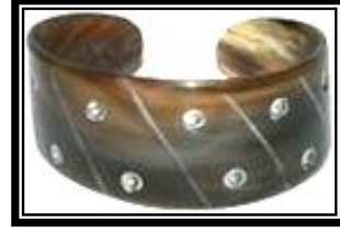
شكل (١ - هـ)

يمثل سوار على هيئة حية كموتيفة ذات الموروث الشعبي واستخدام التحزيز من المنتصف للخارج على هيئة خطوط مائلة متوازية