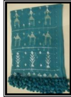
شكل (ز - ٢)

الذي يمثل مجموعة منتقاة معروضة بصورة بسيطة على سلة من الخوص توضح الأشكال والألوان المستخدمة.