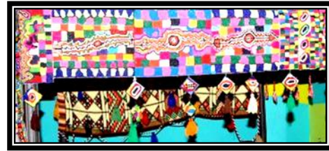
شكل (٤ - ط)

برقع ستائر يتم شغلها بالأقمشة وخياطة الإبرة البارزة، فتجد الزخارف والخطوط والمساحات الهندسية تضمه فى تجانس وتناغم لونى