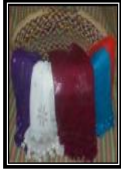
شكل (ح - ٢)

يمثل شال من قماش التلى ويلاحظ لون الأرضية ذات الأحمر القاني والأشرطة الزخرفية الهندسية الممتدة مضيئاً قيمة الايقاع اللوني