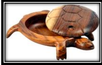
شكل (٦ - د)

يمثل تمثال للصفير حورس مصنوع من خشب السرسوع المصقول