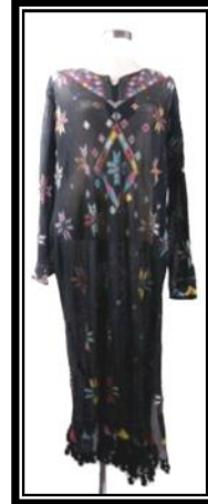
شكل (٢ - ا)

يمثل جلبية (عباية) من القماش الأسود مطرزة بالتلي وهو خيط مصنوع من الفضة موزعة الوحدات الزخرفية بكثافة وأسلوب تلخيصي