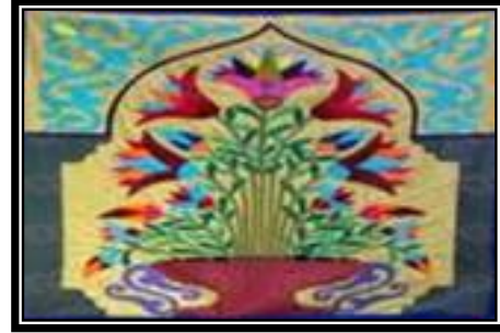
شكل (٤ - ز)

الخيامية بالزخارف الإسلامية بين العضوى والهندسى والألوان الزاهية