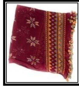
شكل (هـ - ٢)

يمثل شال من قماش التلى ويلاحظ لون الأرضية التركوازي والوحدة الزخرفية الهندسية يحتضنها للداخل مثلثات مفتوحة تتقابل رؤسها