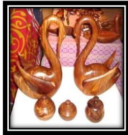
شكل (٦ - ب)

يمثل عقد الزينة مستخدماً خيوط النايلون والأشكال الهندسية