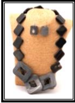
شكل (١ - ي)

يمثل مجموعة متكاملة من الاكسسوار تعددت بها أساليب التشكيل سواء بالتفريغ أو القطع أو التجميع أو بالتحزيز أو الصقل