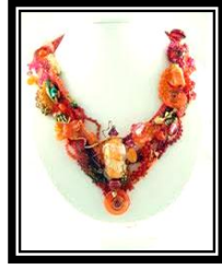
شكل (٥ - ب)

يمثل عقد الزينة المصنعة يدوياً ويستخدم الخرز بأحجامه وأشكاله