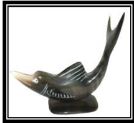
شكل ( ١ - د )

يمثل طفاية سجانر، به قاعدة مستطيلة الشكل يعلوها كتلة مفرغة يمتد منها أفرع توحى بأنها أفرع شجر يعلوها طائرين متناغمين