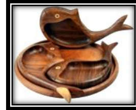
شكل (٦ - ج)

يمثل سلحفاة مجوف ظهرها ليمثل وعاء يعلوها غطاء مزخرف بالحفر