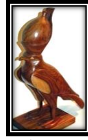
شكل (٦ - أ)

يمثل بجعتين أمامهما مجموعة من العلب المصقولة بأشكال مختلفة