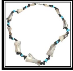
شكل (١ - ح)

يمثل سوار على هيئة ثلثي المعصم وبنهاية بيضاوية مفتوحة يستخدم التحزيز على هيئة خطوط مائلة متوازية تحصر بينها دوائر مصفولة