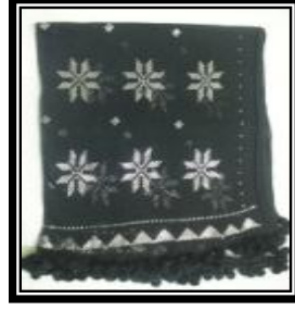
شكل (ج - ٢)

يمثل شال من قماش التلى مع اضافة متغير لون الأرضية البيضاء والخيوط الذهبية ويلاحظ التردد والتكرار المنتظم للوحدات والمسافات