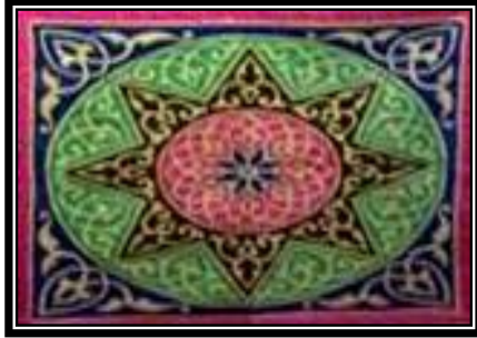
شكل (٤ - ح)

يمثل مجموعة من الزهور المتنوعة من حيث الشكل والحجم واللون