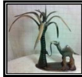
شكل (١- ج)

يمثل مقلمة للمكتب، به قاعدة محاطة بإطار زخرفي، ويعلوها مكان اسطواني لوضع القلم بجواره طائر جميل يتطلع لأعلى