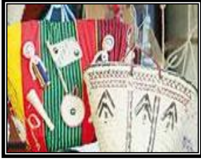
شكل (٣ - ج)

يمثل حقيبتان أحدهما فى الأمام مصنعة من سعف النخيل ذات شكل شبه مخروطى وأخرى معالجة بالسعف الملون بالأصباغ الطبيعية