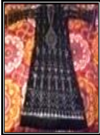
شكل (٢ - ب)

يمثل هدية يدوية...عقد وحلق حفر على قرن الشطة كأعمال يدوية