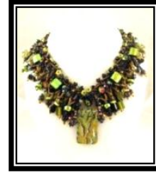
شكل (٥ - أ)

يمثل عقد الزينة المصنعة يدوياً ويستخدم الخرز بأحجامه وأشكاله