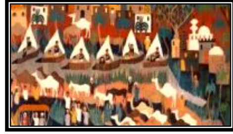
شكل (٤ - ج)

يمثل مجموعة من المباني والعقود ذات الطراز الاسلامى يعلوها مآذن