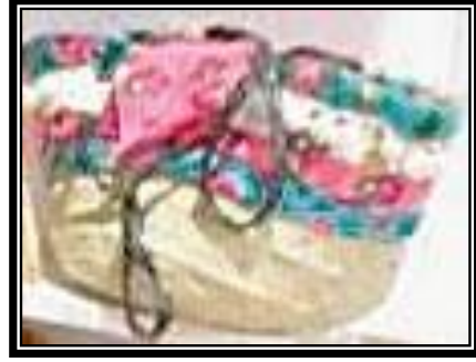
شكل (٣ - ب)

يمثل حقيبتان أحدهما فى الأمام مصنعة من سعف النخيل ذات شكل شبه مخروطى وأخرى معالجة بالسعف الملون بالأصباغ الطبيعية