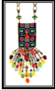
شكل (٥ - د)

يمثل عقد الزينة المصنعة يدوياً بتوظيف الخرز بأحجامه