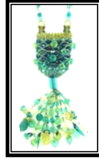
شكل (٥ - ج)

يمثل عقد الزينة أو مستطيل يتوسطه ثلاث خرزات الأحمر والأخضر