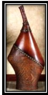
شكل (٦ - و)

يمثل صنية دائرية الشكل تحتوي على ثلاث أشكال متماثلة متجاورة