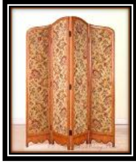
شكل (٤ - و)

يمثل قافلة محمل تعبر مع النيل وعلى جانبيه مع ترحيب وتهليل