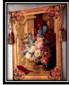
شكل (٤ - هـ)

برافان من الخشب الزان مغطاة مساحاته بالجوبلان وموتيفاته نباتية