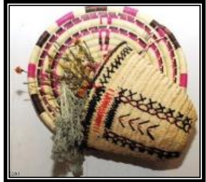
شكل (٣ - ز)

يمثل حقيبة سيدات مصنعة من سعف النخيل المعالج بالأصباغ الطبيعية باللون الأصفر ذات شكل مستطيل يعلوها مجموعة من الخرز