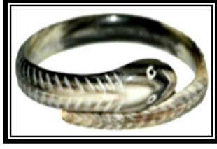
شكل (١ - و)

يمثل سوار على هيئة حية كموتيفة ذات الموروث الشعبي واستخدام التحزيز من المنتصف للخارج على هيئة خطوط مائلة متوازية