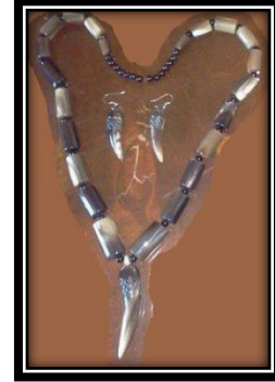
شكل (١ - ط)

يمثل عقد وحلق على شكل قطع مستطيلة متساوية غير مدببة