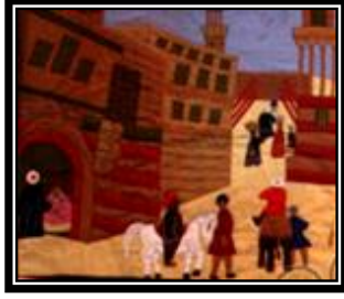
شكل (٤ - د)

يمثل مجموعة من المباني والعقود ذات الطراز الاسلامى يعلوها مآذن