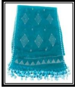
شكل (و - ٢)

يمثل شال من قماش التلى الأسود مطرز بخيط مصنوع من الفضة محاط باطار يمثل وحدات صغيرة ثم اطار آخر على هيئة مثلثات