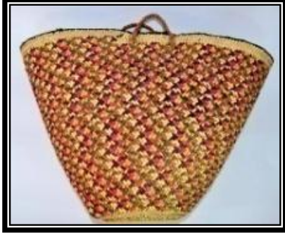
شكل (٣ - هـ)

يمثل حقيبة سيدات مصنعة من سعف النخيل المعالج بالأصباغ الطبيعية بالأبيض بغرز مضلعة كمجموعة عصرية