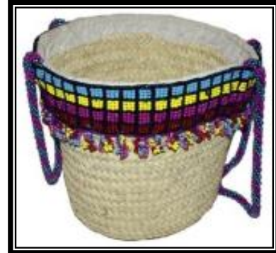
شكل (٣ - و)

يمثل عمل جمالى من سعف النخيل ذو جانب تطبيقى به مجموعة من الزهور والنباتات الجافة والكل مثبت بطريقة مائلة