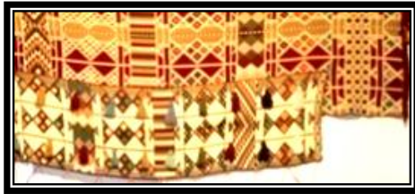
شكل (٤ - ي)

يمثل الخيامية والتي هي عبارة عن مشغولات يدوية من القطن