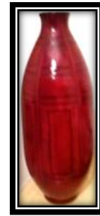
شكل (٦ - ٥)

فازة طراز حديث والتنوع الأسطح المصقولة وبين ترديد الملامس