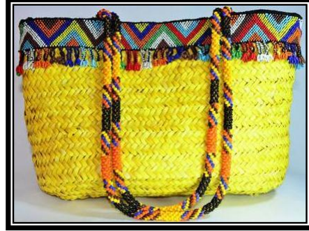
شكل (٣ - د)

يمثل حقيبة سيدات مضفرة من سعف النخيل ذات شكل شبه مخروطى من السعف المعالج بالأصباغ الطبيعية بالأحمر الطوبى والوردى