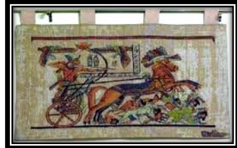
شكل (٤ - أ)

يمثل مشهد مستمد من التراث الإسلامى مع الاهتمام بالتناسم اللونى