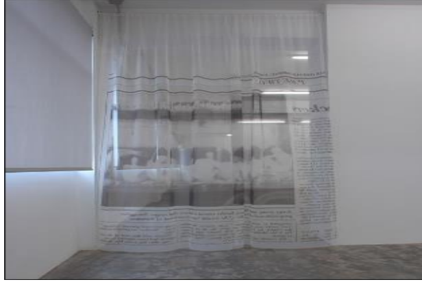
شكل (٧) كل باب جدار - حير على قماش- 200 x 35 Cm

مضامين الوطن حاضرة ومتكررة في أعمال حاطوم، فلها الكثير من الأعمال التي استخدمت الكرة الأرضية والخريطة وغيرها من الرموز التي تدلل على الوطن، وهي هنا تؤكد رغبتها ورغبة الملايين في وضع فلسطين كدولة محتلة في مكانها على خارطة العالم. وعلى سبيل المثال لا الحصر نتناول عملها الموسوم بـ " الانجراف القاري " " Continental Drift " في شكل (٨) الذي يظهر استفادة الفنانة من المولدات الكهربائية للمساعدة في تأكيد فكرة دوران الكرة الأرضية كحقيقة علمية. العمل عبارة عن أسطوانة رسم عليها خريطة العالم، سمكها ٣٣ سم، وقطرها ٢٣٤ سم، مكونة من محرك كهربائي بلور، ومادة غير قابلة للصدأ والحديد. قامت الفنانة بتحريك تلك الدائرة حول محورها من خلال استعمال المحرك الكهربائي. ومن خلال هذا العمل تعود حاطوم لتتناول مفهوم اللاتبات من خلال تحريك تلك الخريطة التي تجسد العالم. فالعالم هو ذلك المزيج من الثقافات والحضارات التي تتحرك في كل اتجاه، ذلك أن الحركة حتى في معناها المادي وليس الثقافي والحضاري فقط هي من سمة هذا الكون والأرض، هي جزء من هذا الكون الديناميكي المتحرك. حاطوم ومن خلال هذا العمل تحاول البحث عن مكان وشرعية لحركتها ووجودها وسط هذه الأسطوانة المتحركة، والتي تحمل في طياتها خريطة هذا العالم. وفي رحلة قامت بها حاطوم إلى منطقة Lake day Sabbath التي تقطنها المجموعات الأخيرة من مجتمعات شيكر، وبخصوص هذه الرحلة تقول حاطوم: " كان إحساساً أشبه بالجو العائلي يحوم في مجتمع "شيكرا" الذين أحيوا في احتياجات منسية، لقد احتضنونا كما لو كنا أهلهم، وأعتقد أنه موقف جريء، لأنه من غير المعلوم كيف يتصرف الفنانون. كان هناك شعور جميل بالاستقرار، والحياة المنزلية الدافئة على النقيض تماماً من حياتي الترحالية ". (أنتوني: