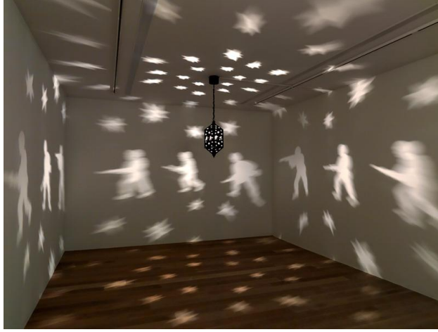
شكل (٢) مصباح - ٢٠٠٦ - مصباح نحاسي، سلسلة معدنية، مصباح كهربائي، متحرك كهربائي دوّار | ٦٠ × ٣٥ × ٣١ سم

وبنفس الاستراتيجية في تحريف الوظيفة المألوفة تُظهر حاطوم في عملها "طبيعة صامتة قنابل رمان" (٢٠٠٨) شكل (٣) الالتحام البارع بين المادة والمضمون. "فعدن النظرة الأولى، تبدو القطع هنا كقطع من الخزف لأوان صغيرة وقد صيغت هذه الأشكال الملونة في قوالب يدوية على شكل رمانة، بأنماط مختلفة، كالأشياء المتعارف على كونها رمانة، مثل الكرة، والبيضة، والليمونة والأناناس، وهي شبيهة بتشكيلة منتقاة من الحلوى المغربية، وبالتمحيص القريب فقط يدرك المشاهد الشبه المرئي القوي بين قطع الحلوى وهذه الرمانة اليدوية، وهي إذ تتخفى في هيئة شيء رقيق تزييني، فإن الرمان يقلب التدايعات المرتبطة بالحرب والموت. ويمثل العنوان الذي اختارته حاطوم لهذا العمل تحويراً ذكياً". (المقادي: ٢٠٠٨)