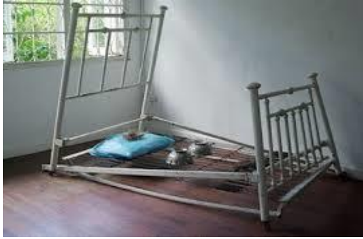
شكل (٥) ما بعد انتحار إرهابي- سرير حديدي وخامات مختلفة

الفنانة صورت فيه مشهد ما بعد انتحار إرهابي عن طريق سرير بدون فراش بشكل يجعل من المستحيل استخدامه وكتلة ذابطة ومشوهة من مطاط وخيوط يجعل منظر السرير الذي اعتاد الناس على استخدامه للراحة والاسترخاء والهدوء يتحول إلى شيء عدواني، وهي هنا تشارك المتلقي غضبها تجاه الإرهاب من خلال تمثيلها بأشياء مألوفة لدى الناس، لكنها لم تعد كما كانت فتجعلهم يطرحون الأسئلة للبحث عن الأجوبة ثم يضعون فرضياتهم.