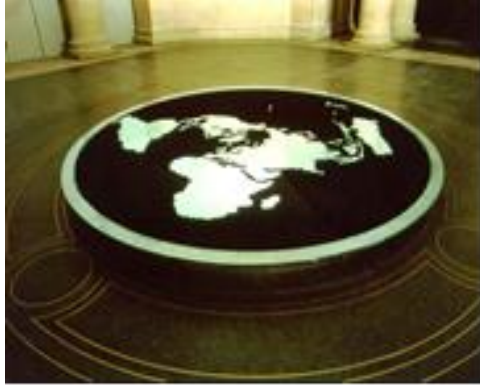
شكل (٨) الانجراف القاري (٢٠٠٠) فولاذ وزجاج وبرادة الحديد، ومحركات كهربائية، ٤٢٠x٣٣ سم

وفي المدينة المتفجرة Pom Pom City شكل (٩) جاء العمل عبارة عن سجادة مترامية الأطراف منسوجة من الحبال الكهربائية الشبيهة بمجسات نباتية تنتهي بمصابيح ضوئية، كابلات وفوانيس كهربائية متداخلة فيما بينها، ومبعثرة في كل الاتجاهات بشكل عشوائي، تترامى بتناغم وإيقاع هادئ، وتومض بوهن. من شكل العمل وعنوانه يمكننا أن نتحدث عن ذلك العالم المختلف في أدق تفاصيله من فرد إلى آخر العالم الذي تنتفي فيه الهوية الفردية لتصبح تلك الهوية المتحركة والمتنوعة فلا مكان للهوية الواحدة بل تلك الهوية الفسيفساء. بيد أن هذا المشهد التأملي مخادع، لأن فكرة السجاد عالمياً يرمز إلى التوطن، إلا أن فكرة المدينة المتفجرة، والمتأهبة للتفجير، يعرض وضع الأرض الفلسطينية في انعدام الأمان فيها كونها أصبحت مدينة موقوتة.