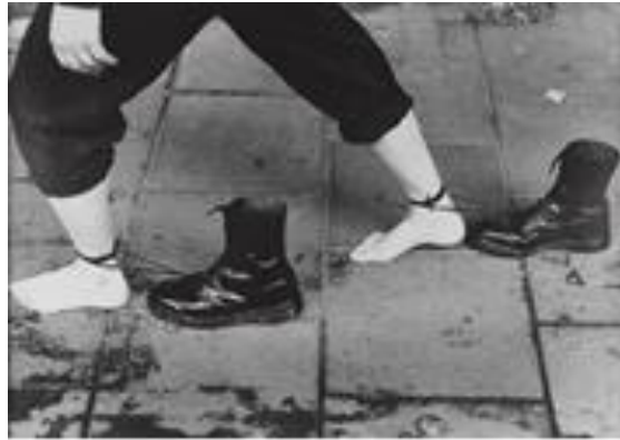
شكل (١٠) المشهد المستمر (١٩٩٥) صورة فوتوغرافية- cm 76.5 x 108

هو عبارة عن صورة فوتوغرافية بالأبيض والأسود والألuminium، أبعادها ١٠٨x٧٦,٥ سم، والصورة عبارة عن مشهد لرجل حافي القدمين، وصورت ساقيه وقد ربطتا بخيوط الحذاء نفسه. تحاول الفنانة من خلال هذا العمل تجسيد الإنسان وذاته، تلك الذات الفطرية التي تعاني الصراع مع الذات المكتسبة. فالحذاء بشكل من الأشكال يرمز للذات المكتسبة، والساقين هما الذات الفطرية. فالذات الفطرية تحاول كبح جماح الذات المكتسبة، وأن تحول بين الإنسان المعاصر واندفاعه نحو ما يتضارب مع إنسانيته وفطرته. فالساقين هما اللتان يحدد بهما الإنسان مصيره ووجهته، إنهما رمز الطريق والمسلك الذي سيسلكه الإنسان، إنها حالة من الصراع الذي تعيشه ذاتية منى حاطوم بين الفتاة التي ترعرعت في مزارع شبعاء، وتلك المرأة التي تتحسس الطريق وسط الضباب الذي يلفها من كل جانب في عاصمة يكسوها الضباب أينما ولت وجهها.