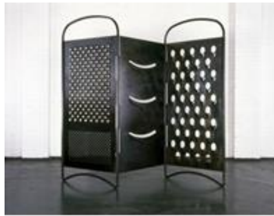
شكل (١٤) التقسيم الرائع (٢٠٠٢)، فولاذ طري، (204 x 3.5 cm) 80 5/16 x 1 3/8 in.