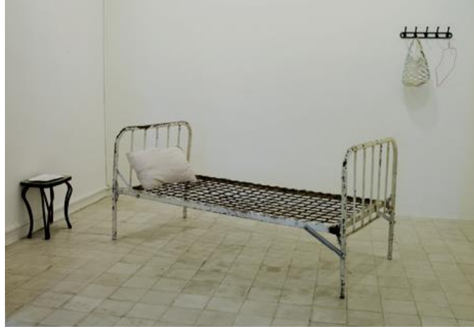
شكل (٦) مشهد داخلي – ١٩٨٨- سرير معدني، وسادة، خريطة، علاقة، شعر بشري، كرسي | المقاسات مختلفة

كما يناقش عمل الفنانة منى حاطوم الموسوم بـ "كل باب جدار" ( Every door a wall ) شكل (٧) قضية التهجير، ومحاولات الهروب التي يعاني منها الكثير من اللاجئين، ويمارسها الكثير من الأسرى. فيظهر العمل في هيئة ستارة شفافة مطبوع عليها مقال من جريدة أجنبية مكتوب بحبر نافث أسود اللون، وفي وسطها صورة لأشخاص عدة في وضعية الجلوس، لا يظهر منهم إلا رؤوسهم وظهورهم. جاء العمل بشكل قطرات صغيرة جدا لتظهر تلك النقاط السائلة شكل الجريدة التي تحمل خبر إلقاء القبض على عمال غير شرعيين تم تهريبهم إلى الولايات المتحدة الأمريكية عبر حدود المكسيك، حيث تم إخفائهم لساعات طويلة داخل شاحنات خانقة، واكتشافهم من قبل شرطة الحدود عبر تقنيات الأشعة السينية التي تحول شكل الإنسان إلى خطوط أو ظلال، وقامت بإلقاء القبض عليهم.