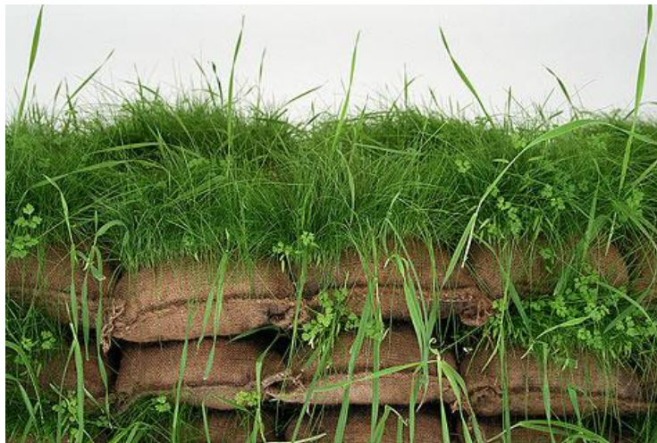
شكل (٤) الحديقة المعلقة - أكياس خيش، تراب، عشب | مقاسات مختلفة