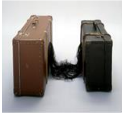
شكل (١٣) حركة السير (٢٠٠٢) - حقيبة معدنية، بلاستيك وشعر 20 1/2 x 31 7/8 x 31 1/2 in. (52 x 81 x 80 cm)

لذلك نجد أن منى حاطوم حتى وإن تطرقت لمسألة الوطن فهي تتناوله بشكل فكري وفني متميز، لكن السؤال الذي يطرح نفسه بشدة من خلال هذا العمل هو: لما اشتمل العمل على حقيبتين؟ لعلّ حاطوم تريد أن تضعنا في مقابلة بين ذلك الشخص الذي يعيش في وطن واضح المعالم، وذاك الشخص الذي يعاني حالة من التيه في الانتماء، فتقول الناقدة الفنية والصحفية أوليفيا هامبتون (٢٠٠٧) في مقال يحمل عنوان (منى حاطوم تتحدى إدراكنا العقلي والجسدي) "منفى أو وطن؟ مسيطر عليه أم سيطرة؟ أسير أم حر؟ هذه الأمور غير المؤكدة، والمتناقضة هي فن منى حاطوم، لا تتوقف الفنانة المتمركزة بين لندن وبرلين عن مفاجأتنا بكشفها عن المتعة في الألم، والغريب في المؤلف، والحضور في الغياب". فحاطوم من خلال عملها الزحمة تحملنا في رحلة حيث يغيب المكان ليفسح المجال أمام اللامكان، ويغيب الزمان ليفسح المجال للزمن المطلق، إنها رحلة نحو حدود اللامعقول بين دفتي حقيبتين يربط بينهما خصلة شعر رمز المرأة والانتماء، إنها رحلة من الثبات إلى اللاتبات "