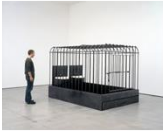
شكل (١٢) مكعب (٢٠٠٢) - فولاذ طري وخشب مصبوغ - (201.5 x 315 x 199.5 cm).

في هذا العمل حاولت أن تحول القفص بمعناه التقليدي للحبس، ليصبح شكلا جميلا، في نظام مرتبّ مطمئن للرأي، تحوله إلى أداة تحكّم باردة، وفي الوقت ذاته وحشيّة؛ لأن هذا القفص الحديديّ ليس له مخارج مع أنه بارتفاع ١٧٤ سم، وحجمه هذا كاف ليتسع إنسانا.