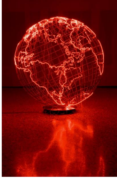
شكل (١١) نقطة ساخنة (٢٠٠٦) فولاذ وإنارة النيون- 234 x 217 cm

وتستوعبه وليس العكس. "هوت سبوت (نقطة ساخنة)" (٢٠٠٦) هو عمل مرحّب ومهدّد في الوقت ذاته – كما يراه المحللون - تدعونا قريبا خطوط إنارة النيون الحمراء الرفيعة التي تحدد أطراف القارّات حتّى ندرك الحرارة المركّزة لخطر يقترب" (هامبتون: ٢٠٠٧). وقد أصبح هذا العالم ومن خلال رمزية الكرة الأرضية يطغى عليه اللون الأحمر الذي فيه إحالة للدماء، ولتقول لنا حاطوم أن لا شيء اليوم أسهل استباحة من دماء البشر في جميع أصقاع العالم. كما يمكننا الإشارة أيضا إلى أن الضوء هو رمز الحركة والسرعة واللاثبات، وهذا الأخير من المفاهيم التي كانت ولا تزال حاطوم تشغل عليها بسبب معانيتها لمسألة اللاتبات في حياتها منذ نعومة مأساتها في مخيمات اللاجئين في لبنان. تقدم حاطوم في "نقطة ساخنة" تجربته ممتعة جماليًا من حيث الشكل، والتوظيف، لكنها كانت خطيرة من حيث الفكرة، لأنها تقدم تهديد بخطر محتمل.