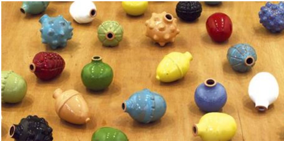
شكل (٣) طبيعة صامتة | ٢٠٠٨ | خزف، خشب | ٨٣,٥ × ٢٠٠ × ١٠٠ سم

وبنفس الاستراتيجية في تحريف الوظيفة المألوفة تُظهر حاطوم في عملها "طبيعة صامتة قنابل رمان" (٢٠٠٨) شكل (٣) الالتحام البارع بين المادة والمضمون. "فعدن النظرة الأولى، تبدو القطع هنا كقطع من الخزف لأوان صغيرة وقد صيغت هذه الأشكال الملونة في قوالب يدوية على شكل رمانة، بأنماط مختلفة، كالأشياء المتعارف على كونها رمانة، مثل الكرة، والبيضة، والليمونة والأناناس، وهي شبيهة بتشكيلة منتقاة من الحلوى المغربية، وبالتمحيص القريب فقط يدرك المشاهد الشبه المرئي القوي بين قطع الحلوى وهذه الرمانة اليدوية، وهي إذ تتخفى في هيئة شيء رقيق تزييني، فإن الرمان يقلب التدايعات المرتبطة بالحرب والموت. ويمثل العنوان الذي اختارته حاطوم لهذا العمل تحويراً ذكياً". (المقادي: ٢٠٠٨)