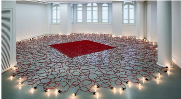
شكل (٩) المدينة المتفجرة (٢٠٠٢) كابلات كهربائية ومصابيح كهربائية

وفي المدينة المتفجرة Pom Pom City شكل (٩) جاء العمل عبارة عن سجادة مترامية الأطراف منسوجة من الحبال الكهربائية الشبيهة بمجسات نباتية تنتهي بمصابيح ضوئية، كابلات وفوانيس كهربائية متداخلة فيما بينها، ومبعثرة في كل الاتجاهات بشكل عشوائي، تترامى بتناغم وإيقاع هادئ، وتومض بوهن. من شكل العمل وعنوانه يمكننا أن نتحدث عن ذلك العالم المختلف في أدق تفاصيله من فرد إلى آخر العالم الذي تنتفي فيه الهوية الفردية لتصبح تلك الهوية المتحركة والمتنوعة فلا مكان للهوية الواحدة بل تلك الهوية الفسيفساء. بيد أن هذا المشهد التأملي مخادع، لأن فكرة السجاد عالمياً يرمز إلى التوطن، إلا أن فكرة المدينة المتفجرة، والمتأهبة للتفجير، يعرض وضع الأرض الفلسطينية في انعدام الأمان فيها كونها أصبحت مدينة موقوتة.