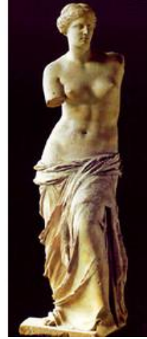
شكل رقم (٣) غادة ويلندورف- العصر البدائي

ويرى أرثر شوبنهاور علم الجمال هو تأمل الجمال وهو أكثر الفكر النقي تحرراً من إملءات الإرادة، هنا نتأمل الكمال من حيث الشكل من دون أي نوع من أنواع الاجتدة، وأي تدخل للمنفعة أو لأهداف سياسية سيفسد الهدف والمعنى الحقيقي من الجمال.