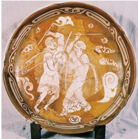
شكل رقم (١٣) طبق خزفى - العصر الفاطمى