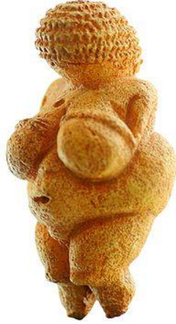
شكل رقم (٤) فينوس - العصر الأثري