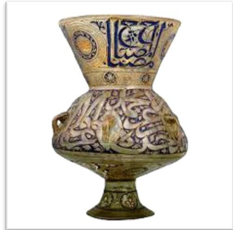
شكل رقم (١٣) مشكاة من الزجاج - مسجد السلطان حسن