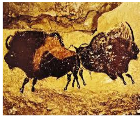
شكل رقم(٥) حيوانات - كهف لاسكو - الفناالبدائي