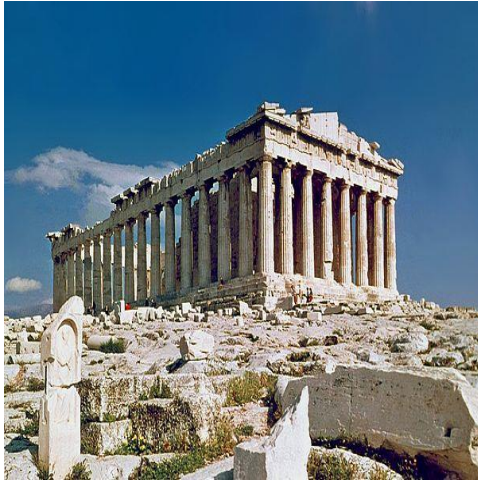
شكل رقم (١٠) معبد البارثينون - عمارة يونانية

وأصبحت المثالية الإغريقية هي الوصول إلى الفردية الكاملة , بحيث أعتبرو مقاييس جسم الإنسان هي المثل الأعلى للجمال وهي المعيار الذى يجب اتباعه فى جميع الفنون ومن هنا جاء الاهتمام بالألعاب الرياضية و ( الأولمبيات ) , كما اهتموا بالأدب والشعر والموسيقى . ١ وكذلك عماره فشيده معبد البارثينون على جبل الأكروبولس شكل رقم (١٠) فى مدينة أثينا بنفس مقاييس جسم الإنسان . وامتاز الفن اليونانى الأغريقى بأنه المثل الأعلى لكمال التكوين , وذلك نراه فى رقة التنسيق وجمال التناسب وبراعه فى التعبير عن المشاعر, وقد اشتهر اليونان بميلهم للطبيعة وتقديسهم للجمال المطلق وكان خيالهم حياً منتعشاً، انعكس أثره العظيم فى تماثيلهم التي تدل على المهارة المتناهية التي اتصف بها فنانون الإغريق القدماء. وقد اشتهرت زخارفهم بجمال إنحناء الخطوط وانسجام سريانها للوصول إلى أعلى درجات التناسق الجمالى.