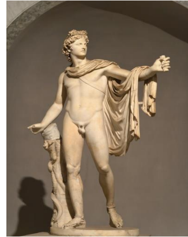
شكل رقم (٩) تمثال أبولو - نحت أفريقى