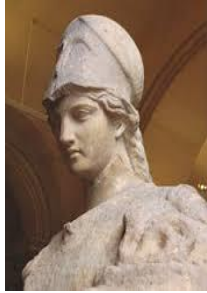
شكل رقم (١) تمثال أثينا للنحات فيدياس -

"ويعرف هيربرت ريد الجمال بأنه وحدة العلاقات الشكلية بين الأشياء التي تدركها حواسنا، ومن المهم أن تؤكد النسبها الكاملة له، وهو ينظر إلى الجمال على أنه ظاهرة متقلبة ظهرت على مدار التاريخ في وجوه مختلفة تتبع الذوق العام السائد وقت إبداع الفن، والذي يتحدد بناء عليه مقاييس الجمال ولا بد للفن أن يتضمن كلها، فإذا قارنا بين مقاييس جمال المرأة في العصر البدائي، نجد تمثال امرأة غادة ويلندورف شكل (٣) في العصر الحجري التي أبدعها الأنسان البدائي وبين مقاييس الجمال المثاليه للمرأة في الفن الإغريقي والتي تظهر في تمثال فينوس ألهة الحب والجمال عند الرومان شكل (٤) لأدركنا الفرق بين معايير الجمال في تلك العصور المختلفه والتي تعبر عن تذوق الجمال بين أفراد المجتمعات في ذلك الحين". ١