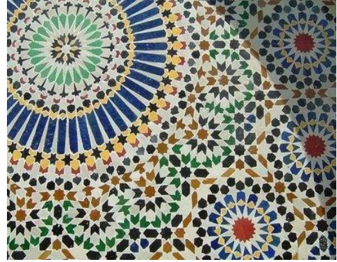
شكل رقم (١١) نموذج للقرش العربى