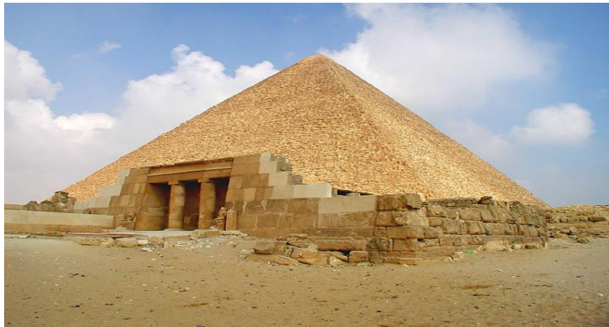
شكل رقم (٨) هرم خوفو - فن العمارة المصري القديم