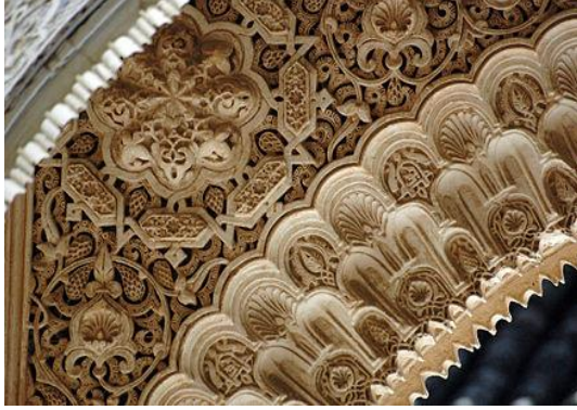
شكل رقم (١٢) زخارف هندسية ونباتيه - فصر الحمراء

وصل الفن الاسلامى من الأبتكار والتنوع فى الفنون المختلفة فى العماره الدينيه والدنيويه مثل المساجد، الأضرحة، الدور، المدارس والمستشفيات (البيمارستان ) والأسبله وما شملت وحدات معماريه هندسيه تخدم الوظيفة ووحدات فنيه تزينيه متنوعه من الأشكال الهندسيه والنباتيه لكى تدخل البهجه والسرور على نفوس المسلمين شكل رقم (١٢) أثناء تأدية الصلوات أو معاملاتهم اليوميه، وأيضاً أبدع الفنان المسلم فى أتقانه ودقه مهارته فى صنع وتجميل الفنون التطبيقية كالزجاج - النحاس - السجاد - الخزف فيعبر عن إيمانه بعمله وصبره من أجل الوصول إلى أجمل النتائج وأما يدل على أنه قادر على نقل الأشياء من الطبيعه كما هى نقلاً دقيقاً , شكل رقم (١٣) .