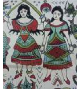
(شكل ٤) (أ)