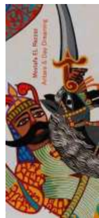
(شكل ١٠) (أ)