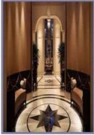
استخدام الإضاءة الخفية لإبراز عناصر الفراغ وترابطها مع الأرضية (السيراميك) - فندق جراند حياة - أثلاثنا