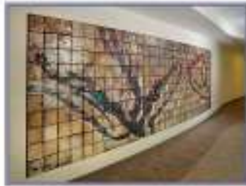
ان تكون جدارية الخرافية ذات اللون وخطوط بارابطة مع ما تعاونه الفراغ من عناصر . استخدام العنق يعمل جداريات خرافية تفر من السكان . http://www.aad-er.com/bestideasforcity.html?ref=Google