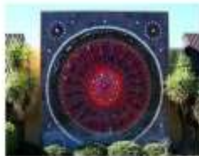
ولاية كاليفورنيا التماثيل والخزافات ملان البهرة في عام 1969 التماثيل البارز المعبر التماثيل.