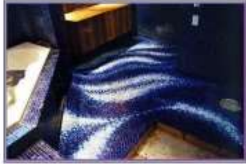
أرضية من الفسيفساء تمثل الصال يسوي للحيز الداخلي http://www.tamistanmosaics.com