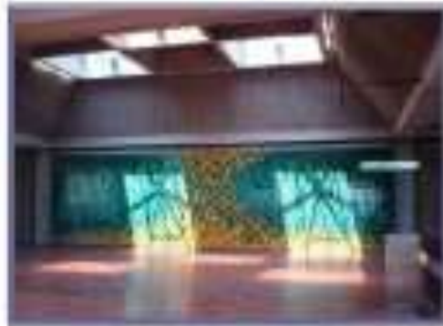
بالفلك من مواد سكرية (2008) [Diamant]