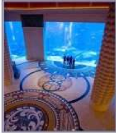
تصميم الأرضية بزخارف متنوعة قنول التلاتس مبي http://www.1bahrain.com

الخزف والفخار له تاريخ طويل ولامعه ، والخزف بدأ جماعيا في الحضارات الانسانية السابقة ، وكان المشجر الفني ينتج بشكل جماعي وبكميات كثيرة وعرضها نفعي ، ولكن مع تطور الفنون بات فن الخزف ذاتيا وبدأ الفنان يعبر عن ذاته ولتت الي فن التعبير كان أيضا يأخذ شكلا عن فلسفة عامة ، إلا ان الفنان الآن استغل الكثير من اشكال التعبير وخدمت للتكنولوجيا الفنان وأصبح منجزه يحمل الكثير من الخيال والتنوع .