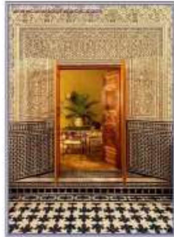
إحدى البيوت المغربية يظهر السجّل ومنطقة الاستقبال والسور المنقوش بالأحجار المسبّبة والبلّاط الأرضية والعرائط الملون وفناء المحيطة والأبواب المزخرفة - فاس المغرب .