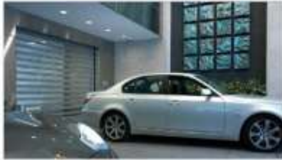
جدارية خزفية في مرآب السيارات في مجمع صارات في فيرديفا http://www.natalieblakestudios.com/project-gallery/commercial-tile-marabi/page/3/