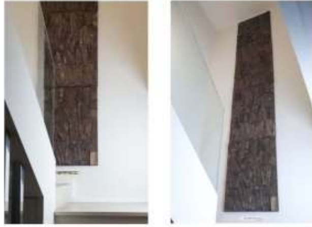
منحوتة جدارية خزفية A ceramic wall sculpture by Clara Graziotino