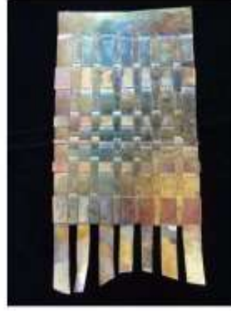
صورة رقم (23)