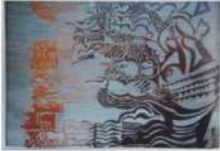
صورة رقم (2)