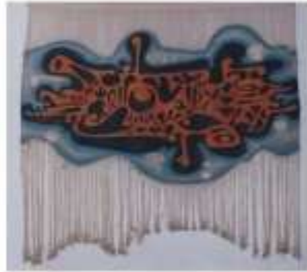
صورة رقم (5)

والخطوط الحرة للشكل الخارجى و الدمج بين عناصر التصميم التى تمثل مجموعة من الزخارف المستوحاه من الفن الشعبى مثل ( الطيور والأسماك والأهنة ) ، و لفظ الجلالة ( لا إله إلا الله ) أعطت إحساس بالحركة والنعمه ، التى أكدها قص الخيوط فى نهاية المشغولة بشكل حر غير منتظم ، وإحساس الثبات الذى توحى به خيوط السداء المشيفه المحيطة بالشكل والتى تظهر فى شكل خطوط رأسية متوازية ، ومن ذلك نجد أن خيوط السداء شاركت فى الصياغة التشكيلية للمشغولة إلى جانب دورها كعنصر أساسى للتعاشق .