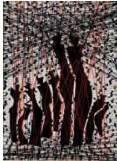
الصورة رقم (47)

ووظفت الفنانة ' هند فؤاد ' السداء المضاف عشوائياً فى العمل الفنى الصورة رقم (47) لتأكيد فكرة العمل، كما لعبت دوراً تشكلياً فى إبراز حركة عناصر التصميم وإحداث تنوع فى المساحات الفراغية وتوزيع الإضاءة ، وتحقيق البعد الثالث الحقيقى.