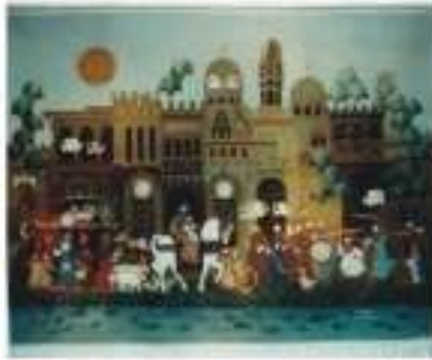
سوريا رقم (1)

التصميم رؤية جديدة للفنان حيث يمثل لنا مشهد واقعي من الحياة الشعبية زاهر بالقيم التعبيرية والرمزية ، والنسج بدرجات لونية متعددة ، عكس الإحساس بتجسيم الأشكال وأكاد الإحساس بالعمل ، من خلال التنوع في توزيع الإضاءة خاصة المساحات المنسوجة باللون الأبيض والتي كونت بؤر ضوئية لإبراز العنصر الأساسي في التصميم ، واستخدام الخطوط اللينة حلق الإحساس بالحركة ، والجمع بينهما وبين الخطوط المستقيمة والزخارف الهندسية في الخطبة ، أكد على تنوع الإيقاع وإبراز حركة العناصر الأساسية للتكوين .