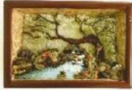
صورة رقم (25)