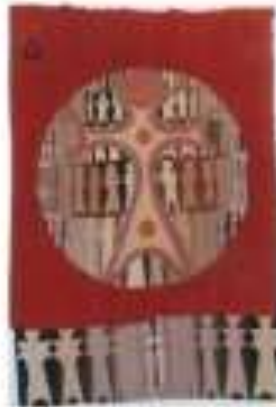
صورة رقم (7)

واستخدم الفنان " صالح رضا " في عملة الفنى صورة رقم (7) المنسوج على هيئة مستطيل باللون الأحمر ويتوسطه شكل دائرى وزع داخله مفردة العروسة المجردة والمميزة لأعماله ،حيث وضعها بحجم كبير مساحة داخل الدائرة ، وقسم الخلفية الى أربع مستطيلات متتالية وغير متساوية وزع داخلها مفردة العروسة بشكل منتظم وبحجم مناسب لعرض المستطيل ،ونسج الجزء السفلى للعمل والذي يترك عادة كخيوط منسدلة ، بمفردة العروسة في شكل متتالي بأحجام مختلفة ،وقد راعى الفنان توزيع الاضاءة والظل والنور من خلال درجات ألوان الخيوط المنسوج بها مفردات التصميم ، وتميز العمل بتنوع فى تكررات الوحدات وتحقيق البعد الثالث الإيهامى وإدراك الحركة بإيقاع شبة منتظم .