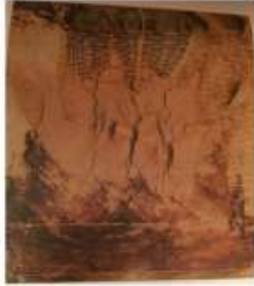
صورة رقم (18)

وتحلق فى هذا العمل العديد من القيم الملمسية والتشكيلية واللونية نتيجة لطبيعة الخامات المستخدمة وخصائصها .