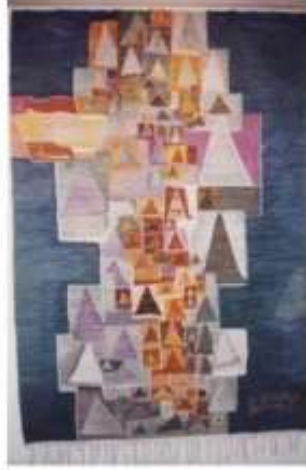
صورة رقم (3)

وتوضح الصورة رقم (4) عمل فني نسجي من تنفيذ أعضاء مدرسة ويصا واصف بالحرانية ، إستمد الفنان تصميمها من الطبيعة المحيطة به من أشجار ونباتات وزهور مختلفة الأشكال ، والسحب في الخلفية ، ونسجت بخيوط الصوف البلدي المصبوغ بدرجات لونية متعددة ، مما نتج عنه تنوع في توزيع الإضاءة ومناطق الظل والنور ، وتأكيد للحركة الناتجة من الخطوط اللينة في أفرع الأشجار وأوراق النبات .