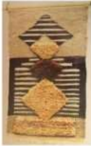
صورة رقم (17)