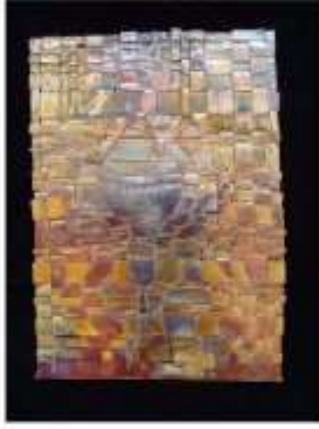
صورة رقم (24)