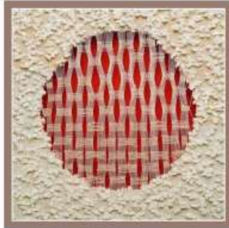
صورة رقم (33)

وظهر في الاعمال الفنية النسجية المعاصرة الإهتمام بالسداء كعنصر تشكيلي ، كما يتضح في الصورة رقم (34) للفنانة ' هيام العدوى ' والتي نسجت بأسلوب التسدية في إتجاهات متعددة مما أثر على المظهر السطحي للتقنيات المستخدمة فتظهر بشكل دقيق عند تكاثف خيوط السداء ، وبشكل أكبر عند تباعد الخيوط ، وتحقق تنوع وتناغم في الخطوط والحركة من خلال خيوط السداء المائلة في إتجاهات مختلفة وخيوط اللحمة المنسوجة بأسلوب اللحمة الحرة ، وأكد ذلك الأجزاء المنسوجة بمساحات متنوعة بالتركيب النسجي السادة .