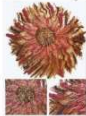
صورة رقم (12)

حفظت الفنانة الحركة الإيهامية في العمل من خلال إستفادتها من الإتجاهات المتعددة لألياف ليف النخيل في تصميم العمل وتحديد المساحات المنسوجة ، كما إستفادت من شكل النهايات الحرة غير المنتظمة لقطعة ليف النخيل التي نفذ عليها العمل لتعكس الإحساس بالإنتشار وعدم الرتابة في العمل .