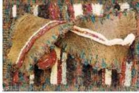
صورة رقم (10)

نجحت الفنانة في تحقيق التعايش بين الخامات المستخدمة ، وأدى الاختلاف بين الخامات إلى تحقيق ملابس متنوعة ومتباينة مما أثرى العمل فنياً ، كما تحققت إيقاعات خطية متعددة ناتجة عن الخامة والتصميم ، وكذلك مستويات متعددة البروز.