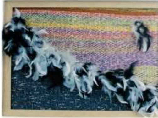
صورة رقم (11)

وإستطاعت الفنانة في عمل آخر - صورة رقم ( 11 ) تحقيق رؤية فنية مختلفة من خلال استخدام الخامة كوسيط رمزي ممثل في الريش كوسيط تشكيلي في العمل الفني النسجي ، وقد ثبتته ليقسم العمل قطرياً إلى نصفين ، وراعت الفنانة في العمل التوافق اللوني بين الريش والخيوط الصوفية المستخدمة ، وتحقق في العمل قيم ملمسية وإيقاعات مختلفة ، وقد شارك الوسيط في تحقيق فكرة العمل (صياح الديك وقت الشروق) .