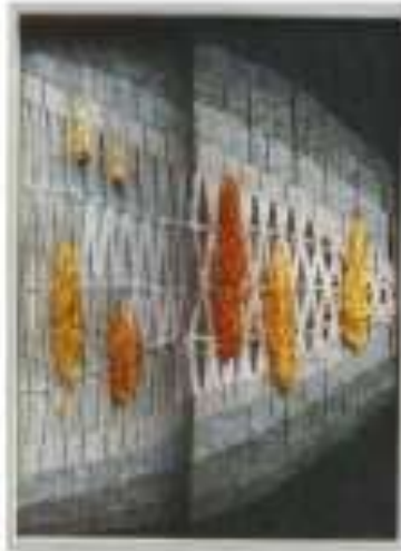
الصورة رقم (43)