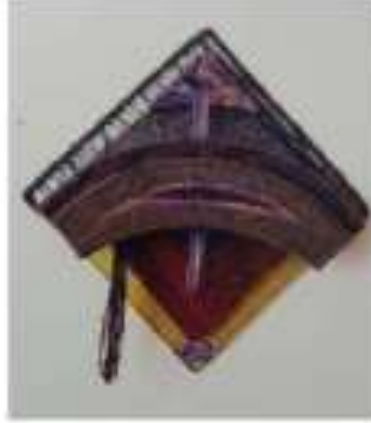
الصورة رقم (42)