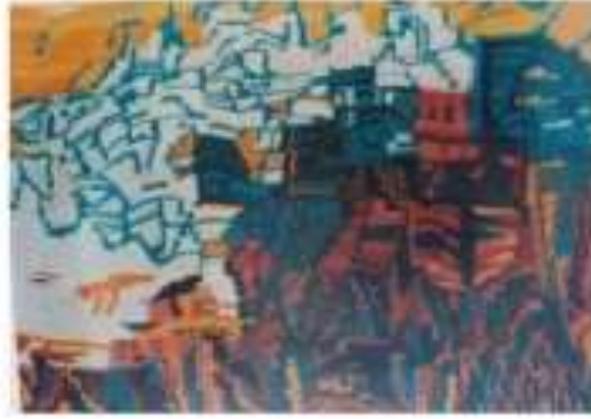
صورة رقم (9)