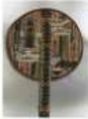
صورة رقم (15)

و في عمل آخر للفتاة صورة رقم (15) رؤية أفري للاستعداد من المعطرة الجرح كبدون كقول وأمان بنتي لتعمل الفلي السحر .