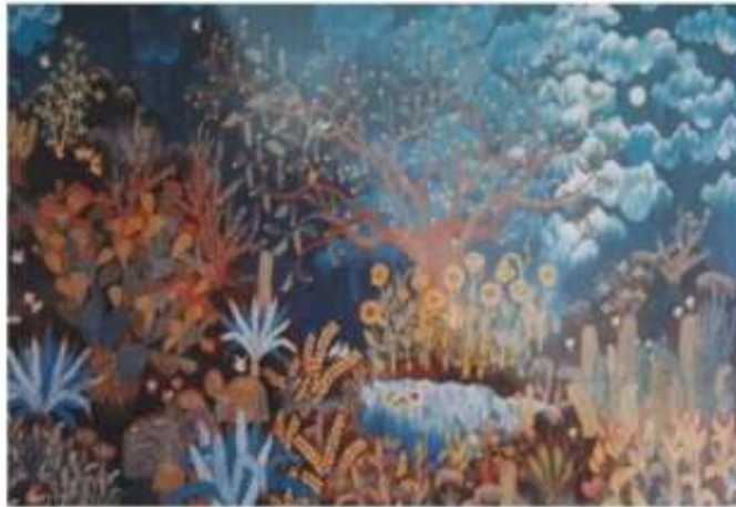
صورة رقم (4)

وإختلاف اشكال النباتات ومساحتها أحدث تنوع في الإيقاع وأكد الإحساس بالحركة ، فالتصميم زاخر بالقيم التعبيرية والتشكيلية النابعة من فطرية الفنان وتلقائيته في التصميم .