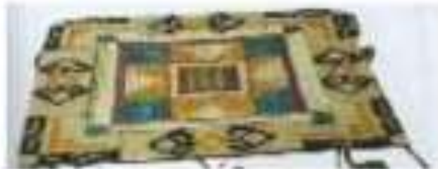
صورة رقم (20)

ويمثل العمل التالي للفنانة ' هبة عبد الفلاح ' صورة رقم ( 20 ) رؤية مختلفة للتوظيف بين خامات السمار مع الكتان والصوف اليدوي في النجمات - واستخدام سلك الشبك الممدد كبديل للسداة - ولم يوظف العمل كمنضدة - تحقل في العمل التعايش بين الخامات المستخدمة ، وتتأقمت الخامات مع مفردات الفن الشعبي المستخدمة ، وتتوح الخامات الأخرى لعمل بالقيم العلامية والتشكيلية ، وعدد مستويات البروز على السطح النسيج .