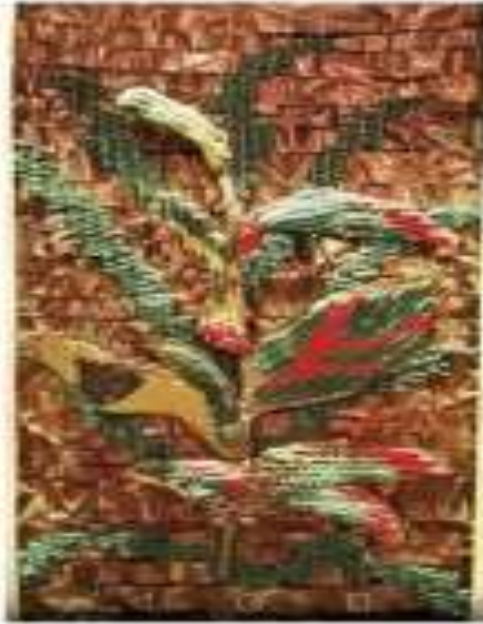
صورة رقم (22)

تحقق في العمل قيم ملمسية وتعدد في مستويات البروز ، كما تحققت الحركة الإبهامية نتيجة للخامة والتقنية المستخدمة .