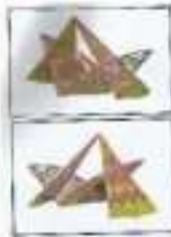
صورة رقم (16)

ويلاحظ في العمل أثر الطامة على مظهر السطح للترايب السجية المستخدمة . و حكمت خاصة السراي قيم ماسية ولونية مختلفة عن تلك التي تحلق باستخدام الطيوب التقليدية . كما يختلف مستوى بروز الترايب السجية المستخدمة نتيجة تما تميز به الطامة من تلمذ في الطيوب ، بالإضافة لمعان ولعابك السطح السحر تبعاً للخواص المعيرة لخاصة السراي .