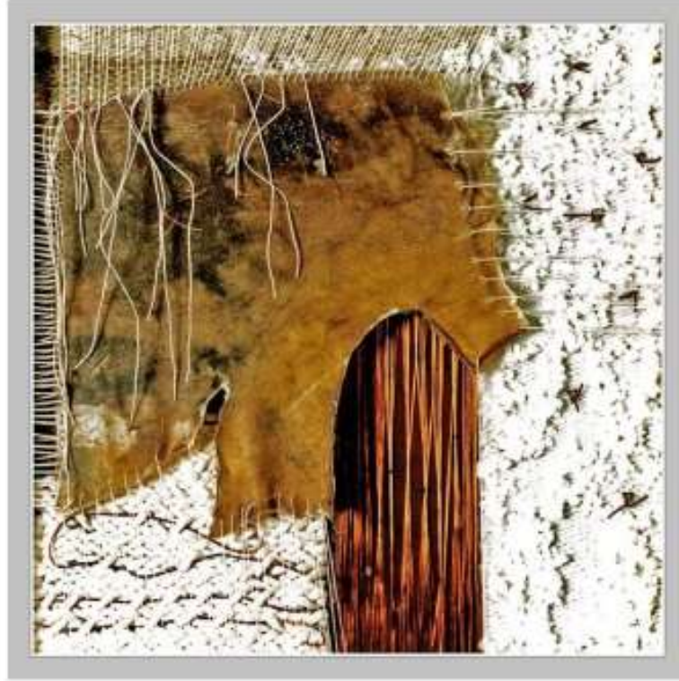
الصورة رقم (27)