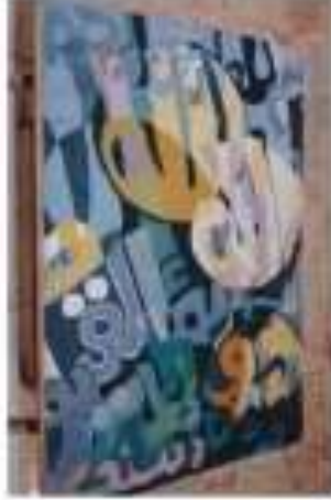
صورة رقم (6)

وشفافية في بعض الأجزاء ، مما نتج عنه إيقاعات وتناغمات متباينة ، أكدها تعدد المساحات والأشكال والخطوط ، سواء كانت علاقات تراكب أو شفافية أو تباين لوني .