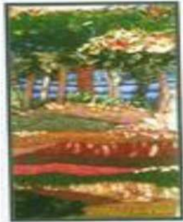
صورة رقم (26)

لتنوع الخامات المستخدمة ، كما تحققت إيقاعات مركبة و تعددت مستويات البروز على السطح النسجي .