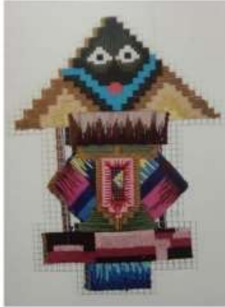
الصورة رقم (44)

وتوضح الصورة رقم (44) عمل للفنان " جمعة حسين " النسيج على شبكة من السلك على هيئة مربعات بأساليب تعاشق مختلفة ، مما سهل تشكيل بعض الأجزاء بعد النسيج وإضافتهما للعمل على هيئة أشكال إسطوانية مما حقق تعدد المستويات وتنوعها .