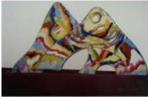
الصورة رقم (41)

ويتكون العمل الثانى من إطارين عضويين الشكل ومنسوجين بمساحات حرة مع الربط بينهما من خلال توزيع المساحات والألوان وحركة الخطوط ، وقد تم تثبيتهم بشكل متتالى على قضيب متحرك ميكانيكياً ، وأثناء الحركة يتقاطع الإطارين تدريجياً ، مما يحدث تنوع فى الفراغ بينهما ويتأثر هيئة العمل تبعاً لحركة الشكل ونقطة التلاقى .