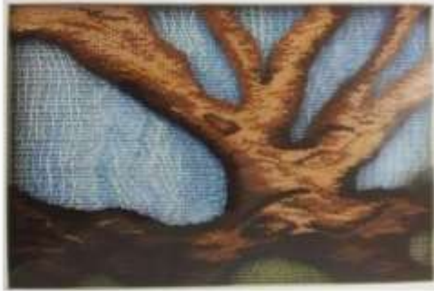
الصورة رقم (38)

والعمل الفني صورة رقم ( 39 ) للفنانة " هند إسحق " خرج بالنسيج المسطح المنسوج على نول البرواز ليتم تشكيله على هيئة مستويات متعددة مجسمة في الفراغ ، وتعد أساليب التعاشق أحدث تنوع في الفراغ وتوزيع الإضاءة وربطه حركة الشرائط بين أجزاء العمل .