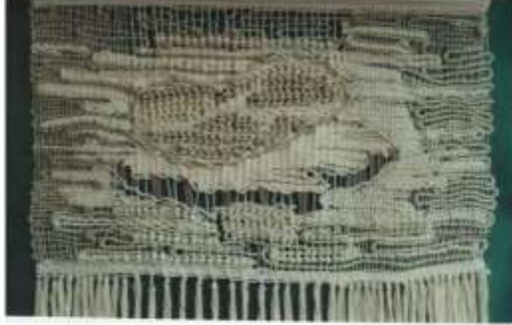
الصورة رقم (28)

والعمل الفني صورة رقم (29) للفنانة " نجوان أنيس " نسج بشكل رأسى على شكل مستطيل وظهر الإطار الخارجى للتصميم بشكل غير منتظم لشد خيوط السداء من النيلون الشفاف واللحمة بخيط القطن بلون واحد ، نفذ العمل بالتركيب النسجى السادة بأسلوب اللحمة غير الممتدة مع ضم اللحمتان فى بعض الأجزاء بشكل غير منتظم ، وتشيف السداء فى أجزاء أخرى ، مما نتج عنه تنوع فى المساحات الفراغية ، التى أثرت على توزيع الإضاءة على سطح المشغولة ، وأكدت الإحساس بالحركة الإيهامية ، فظهرت الأشكال وكأنها تسبح فى الفضاء المحيط .