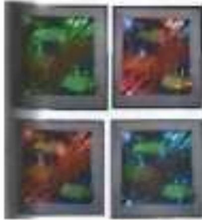
صورة رقم (19)

ضوئية متعددة ومتغيرة وتحدث الإيقاعات نتيجة للإستفادة من خواص الألياف الضوئية وتوظيفها. نتج عن تغير ألوان الضوء وحركته التغير في شكل التصميم وألوانه ، والعمل في مجمله بعد إضافة مجال النسيج اليدوي وبإكث على أهمية التجريب وربط الفن بالتكنولوجيا.