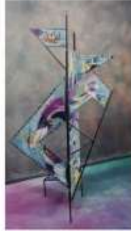
الصورة رقم (40)