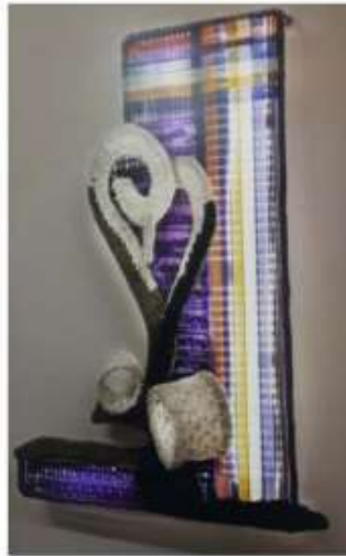
الصورة رقم (45)

والعمل الفني الصورة رقم (45) للفنانة " مرفت رفعت " نسيج على أطر مختلفة وتم تجميعها لتحقيق تعدد في مستويات العمل وأشكالها ، وإضافة عنصر الإضاءة اضى على العمل أبعاد تشكيلية جديدة ، واختلاف أساليب التعاشق حقق تنوع في الملامس ، كما أثر على توزيع الإضاءة على سطح العمل .