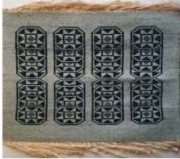
الصورة رقم (31)

ويعد النسيج المبطن من الأساليب النسجية التي تحقق كثافة السطح المنسوج ، وتظهر وحدات التصميم بدقة ووضوح ، كما يمكن تنفيذ السداء أو اللحمة باستخدام خامتين مختلفتين في النوع أو اللون . كما يتضح في الصورة رقم (31) للفنان " هاني فخري "