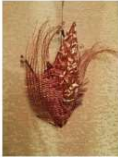
الصورة رقم (21)

تحقق في العمل ملامس مختلفة ناتجة عن الخامة وتقنيات تشكيلها ، كما تعددت مستويات البروز في الشكل نتيجة لطبيعة الخامة المستخدمة في النسج واختلاف سمك أسلاك السداء عن اللحمة . كذلك تحققت قيم خطية واختلاف في توزيع الإضاءة على سطح العمل بالإضافة لتحقق قيم تعبيرية ، وتحققت الوحدة في العمل .