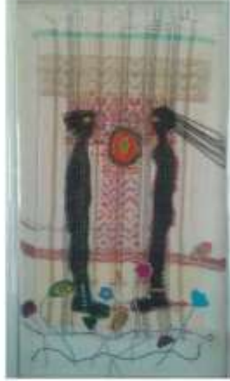
الصورة رقم (48)

ويوضح العمل الفني صورة رقم (48) للفنانة ' سامية الشيخ ' دور اللحامات المضافة في التكوين وإبراز عناصر التصميم وإحداث تنوع في الملامس والخطوط والمساحات ، مما يحقق تناغم في الحركة الإيهامية على سطح العمل .