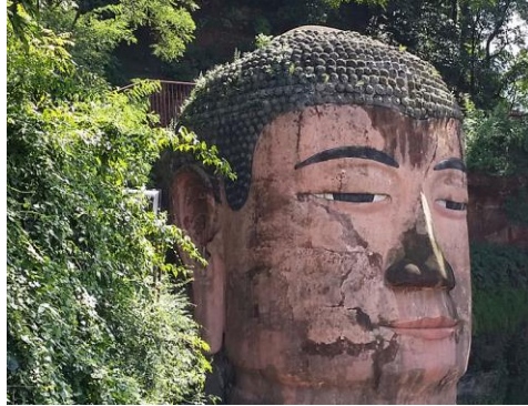
تمثال بوذا العملاق