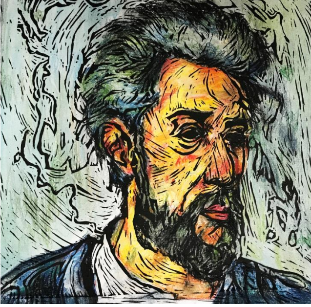
الشكل (17) نتيجة عمل طالبة في الطباعة بالقالب من سطح اللاتينو عمل للفنان بول سيزان