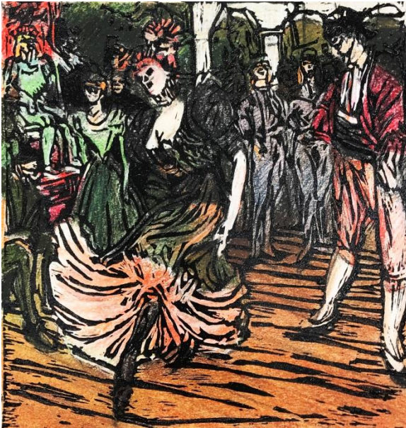
الشكل (13) نتيجة عمل الطباعة بالقالب من سطح اللاتينو (تم عرض خطوات الطباعة سابقا)

على قدرات ودقة الطالبة بتفريغ ومسح اللون في المونوتايب، وحفر في طباعة القالب اللاتينو، كما عرض الباحث خطوات عمل المونوتايب وطباعة القالب، في الشكل (12) نتيجة طباعة المونوتايب وشكل (13) نتيجة طباعة القالب باللاتينو.