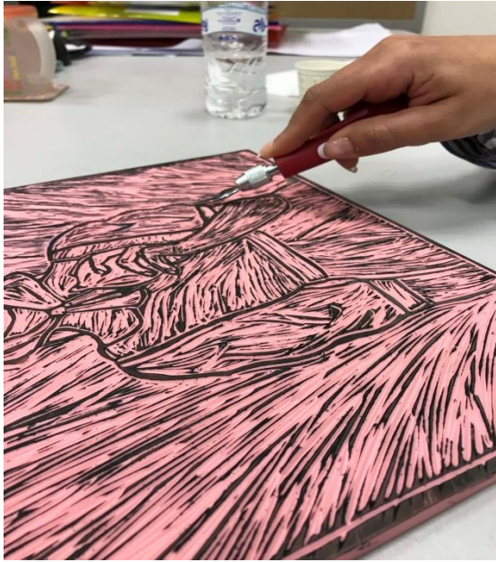
الشكل (18) الخطوة الأولى: ابتكار شخصية للعمل من قبل الطالبة ورسمها على الورقة المستخدمة للطباعة