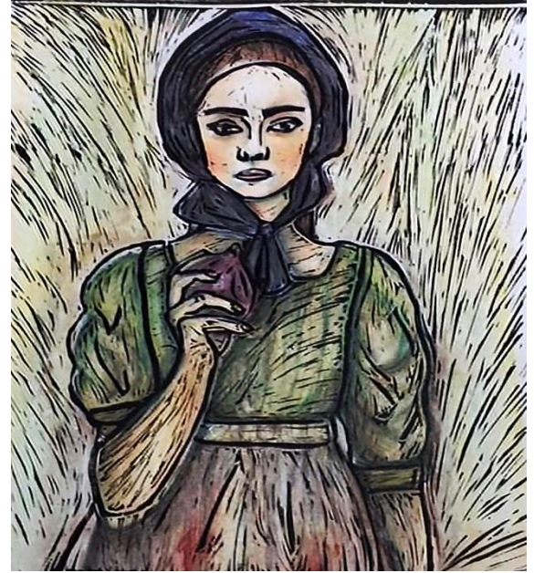
الشكل (19) الخطوة الثانية: التلوين بأسلوب الانطباعيين بألوان السوفت باستيل