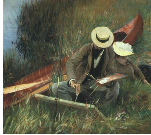
الشكل (2) اللوحة المختارة لطباعة المونوتايب على البلاستيك

١ - رسم خطوط العمل وبداية تلوينها باستخدام ألوان السوفت باستيل للمحافظة على جودة اللون وبناء طبقات اللون لأن الباحث ركز ان لا تكون مساحات اللون في الطباعة مسطحة كي لا تفقد الحس الضوء في اللون كمال في الشكل (4)، وبعدها يتم تثبيت اللون بالمشبب بعد كل طبقة لون يتم بناءها على السطح وتكون النتيجة كما في الشكل (5).