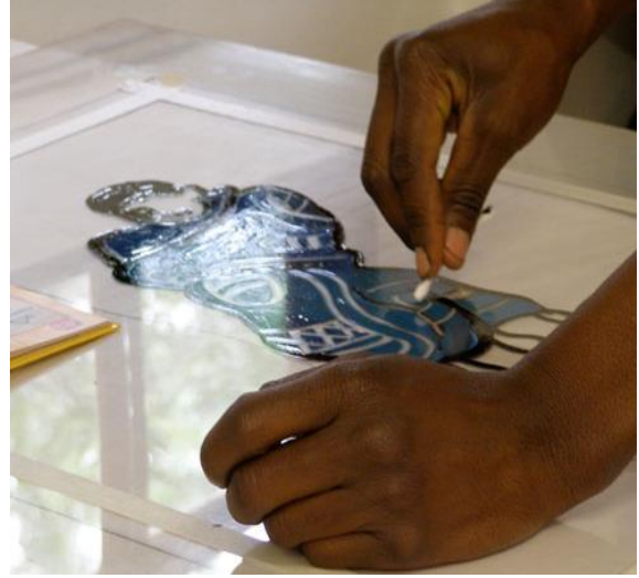
الشكل (10) المونوتايب تفرغ مساحات وخطوط العمل من حبر الطباعة الأسود بالرسم المباشر على سطح البلاستيك عن طريق اعواد القطن

على قدرات ودقة الطالبة بتفريغ ومسح اللون في المونوتايب، وحفر في طباعة القالب اللاتينو، كما عرض الباحث خطوات عمل المونوتايب وطباعة القالب، في الشكل (12) نتيجة طباعة المونوتايب وشكل (13) نتيجة طباعة القالب باللاتينو.