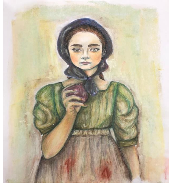
الشكل (21) الخطوة الرابعة: مطابقة مساحة الورقة التي تم تلوينها على سطح الالينه مطباعة العما، طباعة القالب

في هذه التجربة استطاعت الطالبة تطبيق الفلسفة اللونية عند الانطباعيين حيث ان اللون الأخضر تم توزيعه على حسب أماكن الضوء بالعمل، الخضر بدرجاته بالخلفية والجسم والرأس ولكن حس اللون يتغير بحس الظل والضوء في مساحات العمل، وهذه التجربة تثبت نجاح البحث نفسه، حيث نمت الطالبة قدراتها بالطباعة واستيعاب الفلسفة اللونية في الاعمال الطباعية.