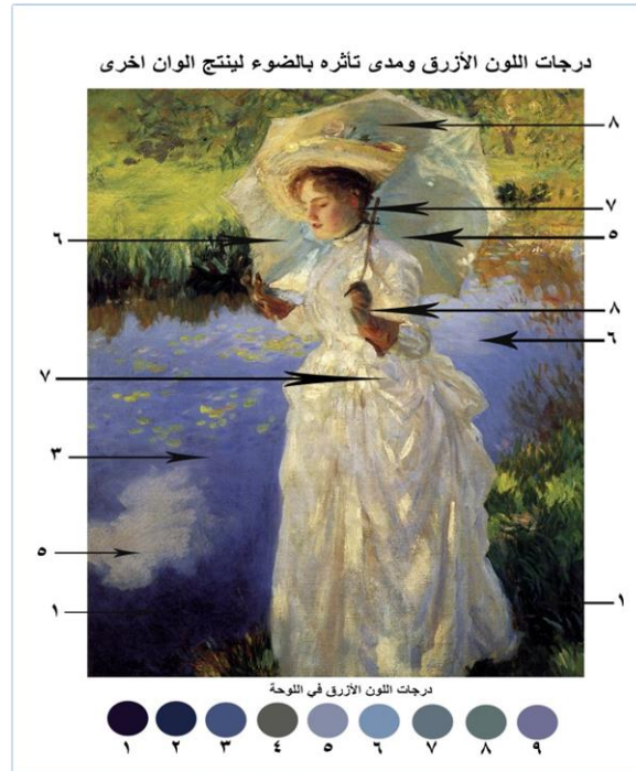
الشكل (1) نموذج يوضح توزيع اللون الأزرق بدرجات تعتمد على الضوء في اللوحة الانطباعي

وكمثال على ذلك وصف الباحث كما في الشكل (1) لوحة للفنان John Singer Sargent بعنوان "Morning Walk (1888)" ويصف الباحث تلك اللوحة للطالبات والانسجام اللوني في الأسلوب الانطباعي ويوضح كيف ان اللون الأزرق يدخل في اغلب المساحات داخل اللوحة ليشكل الانسجام والتناغم اللوني (الهارموني) حيث ان درجة اللون الأزرق تتداخل مع ألوان أخرى وتتغير بحسب زوايا الضوء في اللوحة. 10