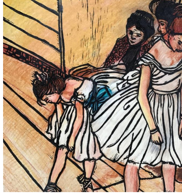
الشكل (14) نتيجة عمل طالبة في الطباعة بال قالب من سطح اللاتينو عمل للفنان ادغار ديغا