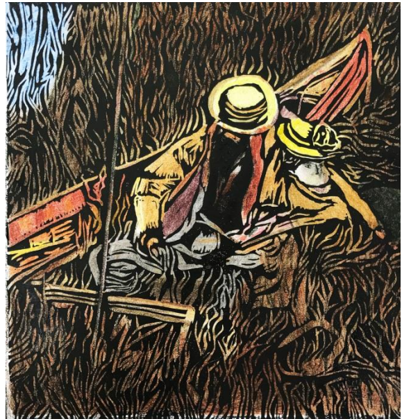
الشكل (12) نتيجة عمل طباعة المونوتايب من سطح البلاستيك (تم عرض خطوات الطباعة سابقا)