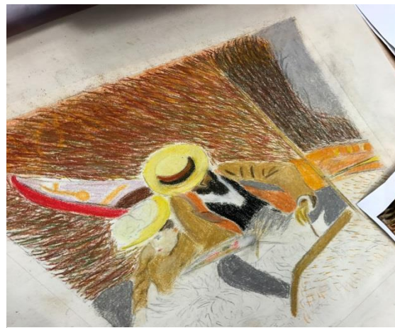
الشكل (4) التلوين على الورق لطباعة المونوتايب