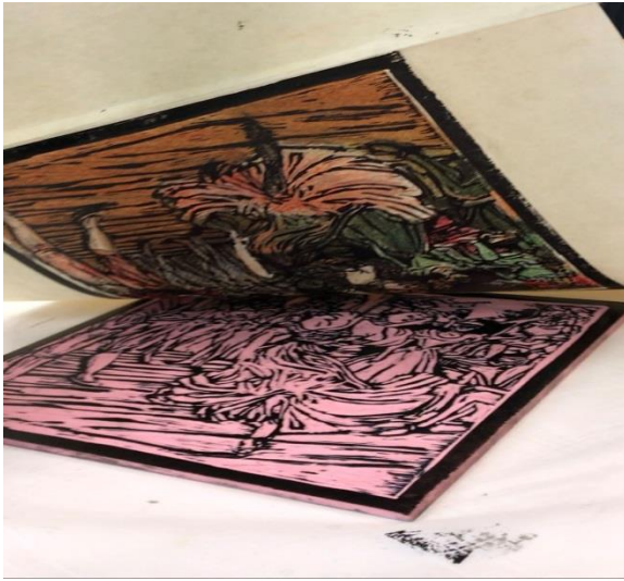
الشكل (9) رفع أطراف الورق من على سطح اللينو أو البلاستيك 3- الخطوة الأخيرة الطباعة كما في الشكل (8) حيث تتم استخدام حبر الطباعة على السطح الذي تم تلوينه

الطباعة بالقالب كما في الشكل (7)، بحيث تتماثل مساحات الخطوط مع الرسم الذي تم تنفيذه على ورقة الطباعة.