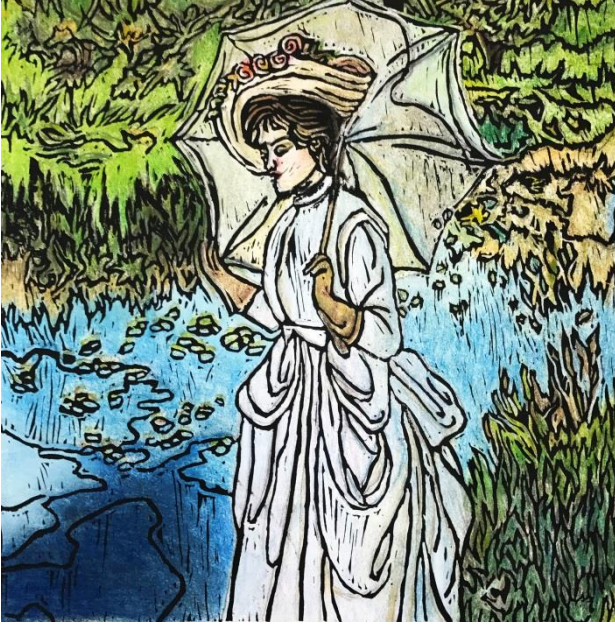
الشكل (15) نتيجة عمل طالبة في الطباعة بال قالب من سطح اللاتينو عمل للفنان جون سنغر سارجنت

في تلك الأعمال تمثل حركة الخطوط أعطت موضوع العمل حده ووضوح مقارنة بعمل الأصلي للفنان، فاختيار لوحات الانطباعيين في هذه الدراسة تعتبر موفقة قياساً بحس وفلسفة اللون الموجودة في العمل الأصلي، تعتبر الطالبات انجزن جزء مهم في جانب فلسفة اللون في الحركة الانطباعية. ففي الشكل (14)، الشكل (15)، الشكل (16)، والشكل (17) نرى الاختلاف بتناول الموضوع الأصلي للوحة والحفاظ على هوية العمل بل واطافة كل طالبة حسها باللون المبنى على استيعابها لألوان الفنانين الانطباعيين.