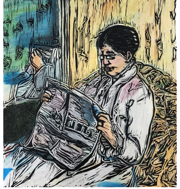
الشكل (16) نتيجة عمل طالبة في الطباعة بالقالب من سطح اللاتينو عمل للفنانة ماري كاسات