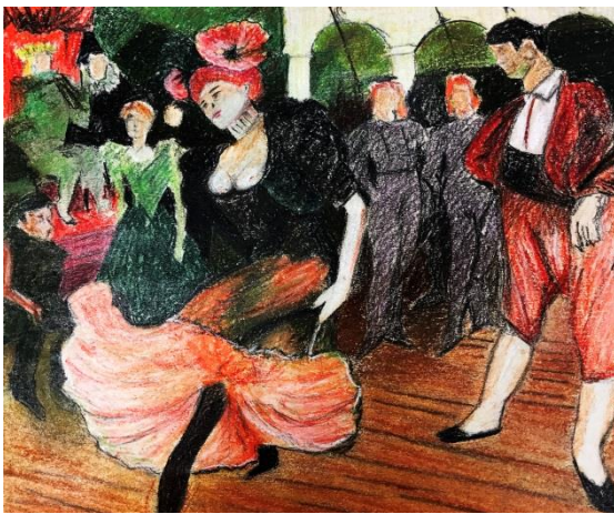
الشكل (5) التلوين على الورق للطباعة بالقالب على اللاينو

٢- يتم رسم خطوط العمل بعض الطالبات باستخدام تقنية المونوتايب بالطباعة باستخدام قطعة بلاستيك بحجم A3 بأسلوب تفرغ ومسح مساحات حبر الطباعة الأسود من على السطح البلاستيك كما في الشكل (6)، وبعض الطالبات يستخدمون تقنية طباعة بالقالب باستخدام سطح اللاينو ويتم حفر سطح اللاينو في