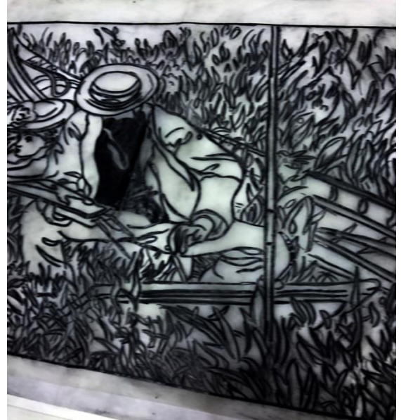
الشكل (6) تفرغ مساحات الخطوط بالرسم المباشر على سطح البلاستيك لطباعة المونوتايب

الطباعة بالقالب كما في الشكل (7)، بحيث تتماثل مساحات الخطوط مع الرسم الذي تم تنفيذه على ورقة الطباعة.