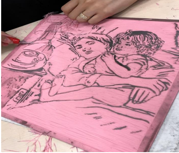
الشكل (11) الطباعة بالقالب حفر خطوط ومساحات العمل من على سطح اللاتينو

ولكن كشكل للنتيجة بعد الطباعة والألوان يرى الباحث ان هناك تقارب كبير بالخطوط ولكن ذلك يتعمد