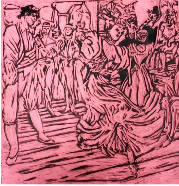
الشكل (7) حفر مساحات الخطوط على سطح اللينو للطباعة بالقالب