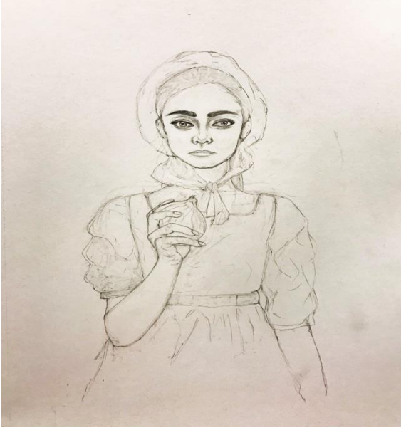
الشكل (20) الخطوة الثالثة: بداية نقل الرسم على سطح الالينو وحفر خطوط العما.