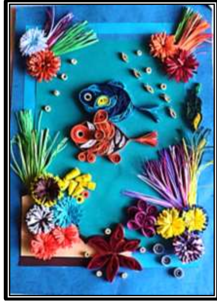
مشغولة رقم ( ٣ ) عمل الطالبة أمنية أحمد محمد