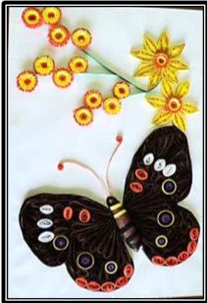
مشغولة رقم ( ١٠ ) عمل الطالبة داليا أشرف السيد