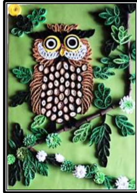
مشغولة رقم ( ١ )