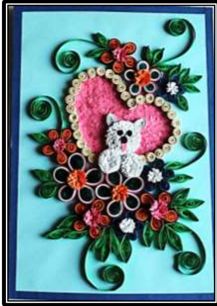
مشغولة رقم ( ٥ ) عمل الطالبة ياسمين طارق سنجر