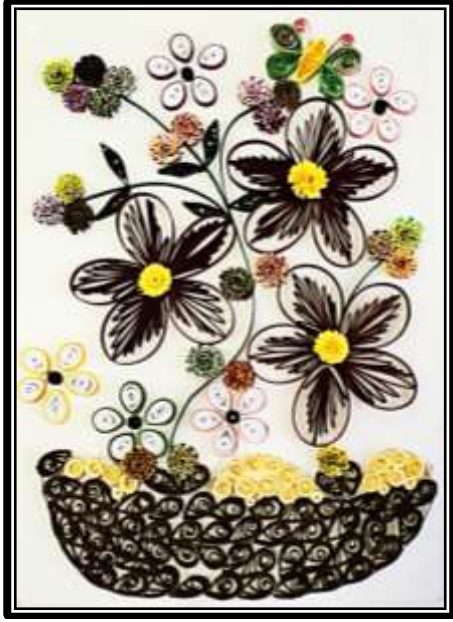
مشغولة رقم ( ٨ ) عمل الطالبة شروق صلاح عطية