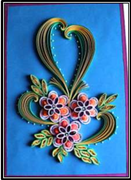
مشغولة رقم ( ٦ ) عمل الطالبة عبير رجب على