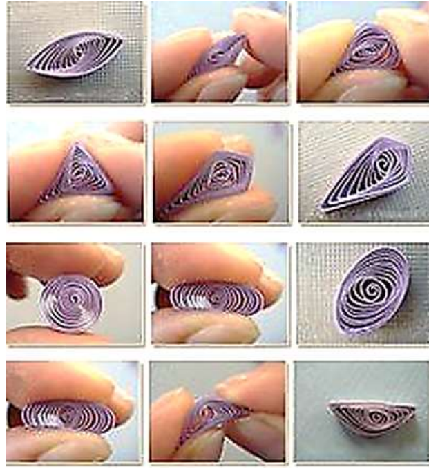
صورة توضيحية لطريقة الضغط بالأصابع