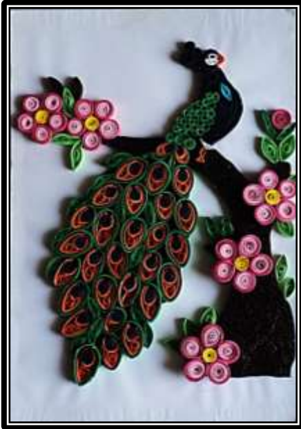
مشغولة رقم ( ٢ )